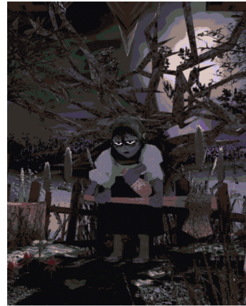
Carimara: Beneath the forlorn limbs

Deux propositions au cœur de la thématique « L'Art du mensonge » : No, I'm Not a Human à jouer sur grand écran et un décryptage de l'influence de David Lynch sur l'art vidéoludique. Dans le cadre des Video Game Masters, Marine Macq reçoit le créateur de Carimara: Beneath the forlorn limbs .