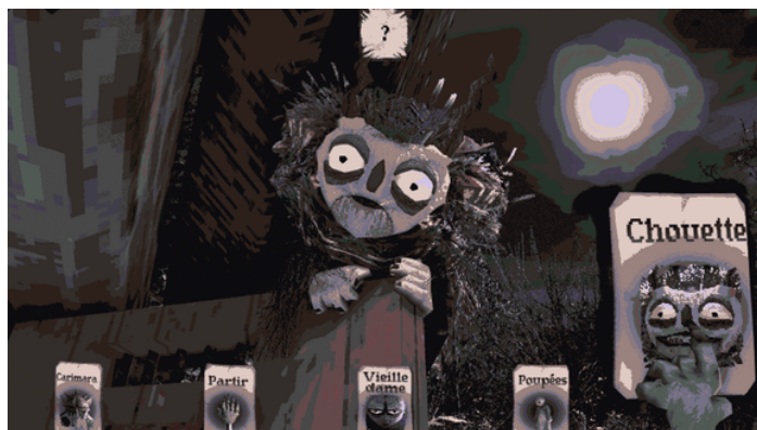
Carimara: Beneath the forlorn limbs