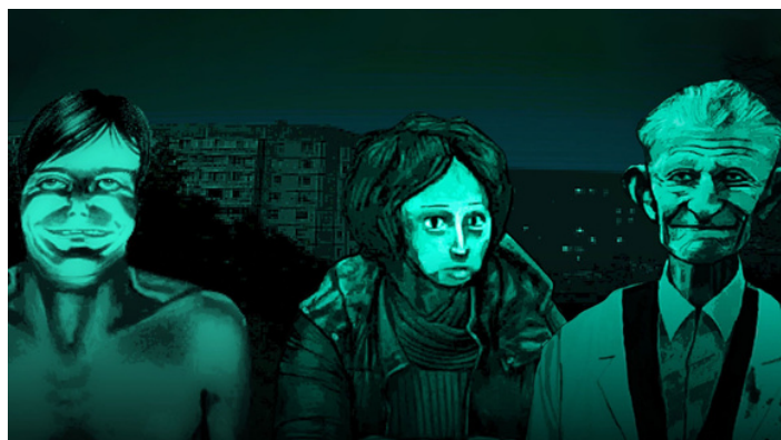
No I'm not a human © studio Trioskaz - Critical Reflex