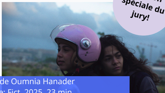
Bimo de Oumnia Hanader France; Fict. 2025 23 min