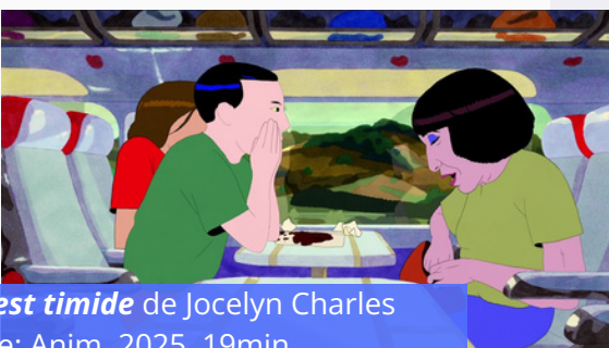
Dieu est timide de Jocelyn Charles France; Anim. 2025 19min

Séance gratuite sur inscription via ce lien