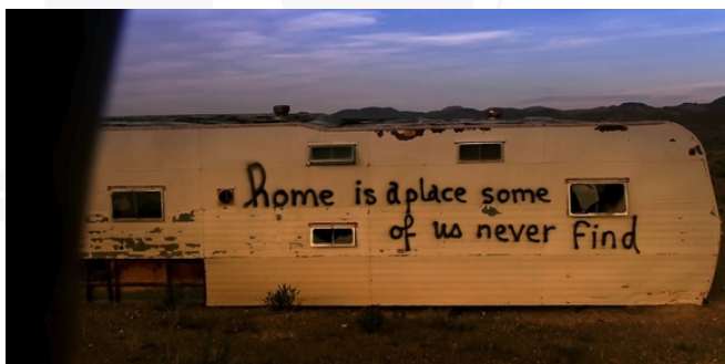
Les Recommencements

Au programme : luttes écologiques, rire comme arme de résistance, politiques de l'attachement, représentations de la rage féminine et impact des algorithmes. Un rendez-vous hebdomadaire pour penser autrement le cinéma et le monde.