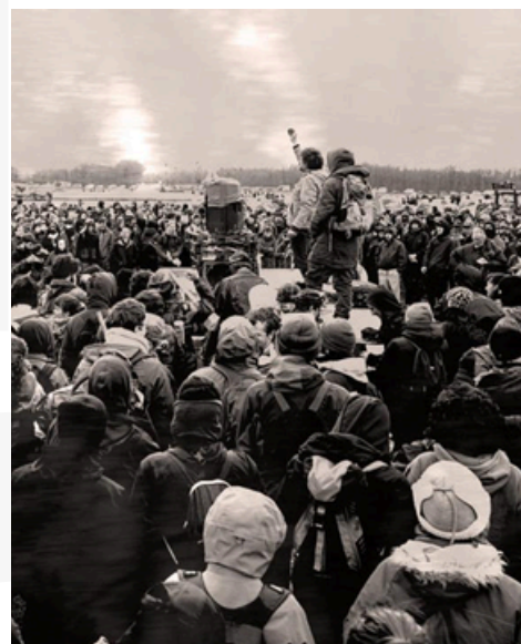
Soulèvements