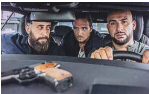
© 2017 Turner Broadcasting System Europe Limited, Wiedemann & Berg Television GmbH & Co. KG

Toni prépare en cachette sa réorientation professionnelle pour sortir du trafic de drogues, de la prostitution et du blanchiment d'argent. Mais quand son beau-frère est arrêté lors d'un raid, impossible de quitter la tête du clan de Berlin-Neukölln. C'est une question d'honneur. Cette série de gangsters rythmée et incarnée dresse le portrait d'un Berlin-Est sous tension. Le Gomorra allemand !