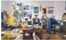
SUPA SUPA