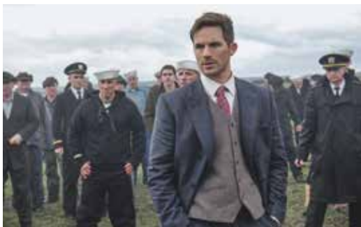
© 2017 Sony Pictures Television Inc. All rights reserved

Une machine à voyager dans le temps est volée par un homme déterminé à parasiter le passé, afin de transformer l'histoire des États-Unis. Une équipe de trois « chasseurs » composée d'une universitaire, d'un ingénieur et d'un flic, le poursuit. Eric Kripke ( Supernatural ) et Shawn Ryan ( The Shield ) réécrivent l'Histoire de manière réjouissante dans cette série ludique et bien rythmée !