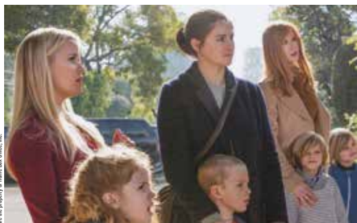
© 2016 Home Box Office, Inc. All rights reserved. HBO® and all related programs are the property of Home Box Office, Inc.

Jane, jeune mère célibataire fraîchement installée à Monterey, accompagne son fils pour sa rentrée. Elle y fait la connaissance d'autres mères de famille, parfaites représentantes d'une communauté aux apparences paradisiaques mais trompeuses. David E. Kelley ( Ally McBeal ) et Jean-Marc Vallée ( C.R.A.Z.Y. ) grattent le vernis de la bourgeoisie californienne dans un drame à l'écriture piquante et au casting « all stars ».