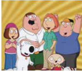
FAMILY GUY - LES GRIFFIN © 2005, 2009 Fox and its related entities. All rights reserved.