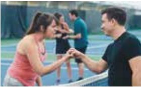
LA PRATIQUE DU LOISIR AU CANADA