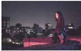
KALI © Amit Ashraf & Bioscope Live