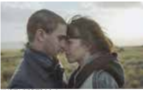
AHI AFUERA / OUT THERE

Le jour, la discrète Amaya travaille dans une ONG. La nuit, elle se transforme en Kali, super-héroïne s'attaquant aux crimes impunis. Une série étonnante et engagée contre les violences faites aux femmes.