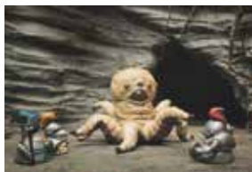
PIGEONS & DRAGONS

Rendez-vous sur series-mania.fr pour découvrir en avant-première la sélection de séries web et digitales et voter pour votre préférée avant le 22 avril à minuit.