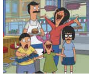
BOB'S BURGERS © 2011-2012 Fox and its related entities. All rights reserved.

LUNDI 17 AVRIL À 20H UGC CINÉ CITÉ LES HALLES