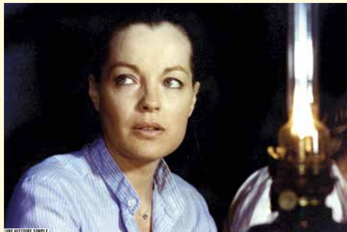
UNE HISTOIRE SIMPLE

Pongo et Perdita, un couple de chiens dalmatiens, vivent heureux avec leurs nombreux chiots. Mais la méchante Cruella, qui rêve d'un manteau en peau de dalmatiens, entreprend de les kidnapper. Pongo fait alors appel à tous les chiens de la ville pour libérer ses petits et les autres victimes de Cruella. Un dessin animé riche en émotions : du grand Disney !