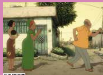
AYA DE YOPOUGON

DÉTAILS DES SÉANCES SUR FORUMDESIMAGES.FR