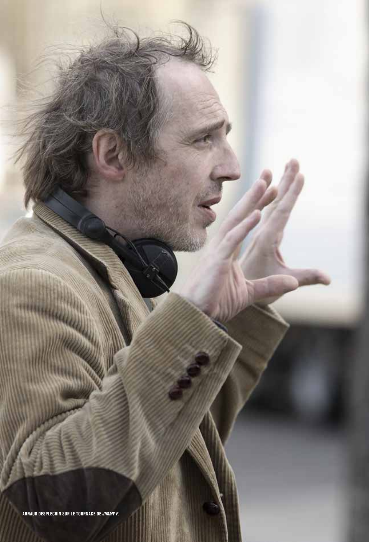
ARNAUD DESPLECHIN SUR LE TOURNAGE DE JIMMY P.