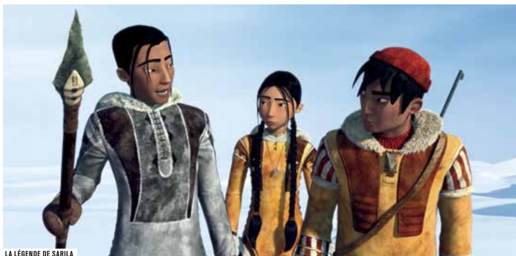
LA LÉGENDE DE SARILA

france culture C'EST POUR VOUS À PARIS SUR 93.5 FM