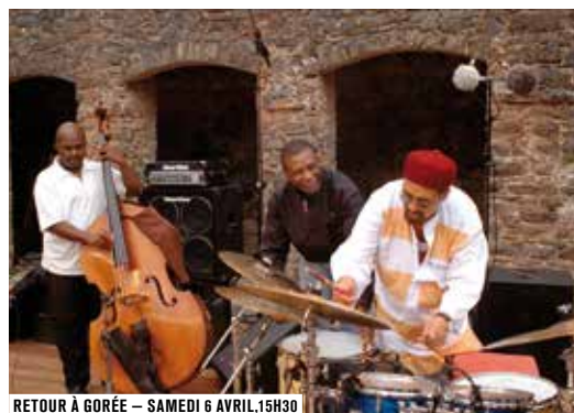
RETOUR À GORÉE — SAMEDI 6 AVRIL, 15H30

« Je suis un insoumis qui a redonné à La Marseillaise son sens initial », disait Gainsbourg de sa version jamaïcaine de l'hymne national, enregistrée à Kingston avec les choristes de Bob Marley. Cette Marseillaise métissée, qui lui valut un scandale et un disque d'or, puise aux sources du reggae, né du combat contre la misère des ghettos et la souffrance du peuple noir ( The Harder They Come ). Comme l'Afrobeat de Fela a rythmé son combat sans relâche contre le pouvoir en place au Nigeria ( Suffering and Smiling ), le rock endiablé des Chats persans fuyant la police de Téhéran prouve l'engagement de la musique contre l'injustice et l'oppression. « La musique est l'arme la plus puissante, parce qu'elle sauve » (Marley) pourrait être la devise d' El Sistema , programme national d'éducation musicale instauré au Venezuela pour combattre la criminalité. Arme de paix et de fraternité, elle œuvre aussi dans La Visite de la fanfare et dans la tournée commune de musiciens juifs et palestiniens ( Une seule voix ), comme elle guide le Retour à Gorée de Youssou N'Dour sur la trace des esclaves et de la musique née de leur histoire.