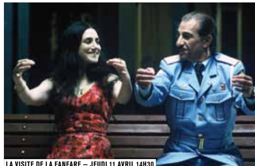
LA VISITE DE LA FANFARE — JEUDI 11 AVRIL, 14H30

« Je suis un insoumis qui a redonné à La Marseillaise son sens initial », disait Gainsbourg de sa version jamaïcaine de l'hymne national, enregistrée à Kingston avec les choristes de Bob Marley. Cette Marseillaise métissée, qui lui valut un scandale et un disque d'or, puise aux sources du reggae, né du combat contre la misère des ghettos et la souffrance du peuple noir ( The Harder They Come ). Comme l'Afrobeat de Fela a rythmé son combat sans relâche contre le pouvoir en place au Nigeria ( Suffering and Smiling ), le rock endiablé des Chats persans fuyant la police de Téhéran prouve l'engagement de la musique contre l'injustice et l'oppression. « La musique est l'arme la plus puissante, parce qu'elle sauve » (Marley) pourrait être la devise d' El Sistema , programme national d'éducation musicale instauré au Venezuela pour combattre la criminalité. Arme de paix et de fraternité, elle œuvre aussi dans La Visite de la fanfare et dans la tournée commune de musiciens juifs et palestiniens ( Une seule voix ), comme elle guide le Retour à Gorée de Youssou N'Dour sur la trace des esclaves et de la musique née de leur histoire.