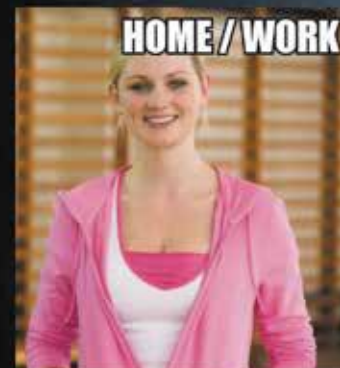
Pays de Galles