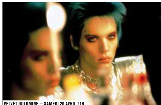
VELVET GOLDMINE — SAMEDI 20 AVRIL, 21H

Avec sa chanson « Rebel Rebel » (1974), David Bowie, cheveux orange hirsutes et combinaison pailletée ultra-moulante en pleine période glam rock ( Velvet Goldmine , Les Runaways ), se faisait l'étendard d'un mot, d'une attitude par essence liée au rock: la rébellion. James Dean était déjà un « rebelle sans cause » (titre original de La Fureur de vivre ) en 1955. Elvis, admirateur de l'acteur, a repris certaines de ses postures, mais le cinéma, grand créateur et consommateur de mythologies, n'a fait qu'une bouchée du King en le domestiquant, réduisant l'indocile idole à un personnage insipide. D'autres icônes redonneront au rock sa force subversive: les Sex Pistols ( Sid et Nancy , L'Obscénité et la fureur ), ingérables, irrécupérables, qui jusqu'au bout incarneront le no future , la remise en cause des valeurs établies. Le tremblement de terre punk aura de nombreuses répliques ( 24 Hour Party People , Joy Division ), relayées par d'autres figures musicales de la contestation: les chanteurs de rap ( Réussir ou mourir , Block Party ).