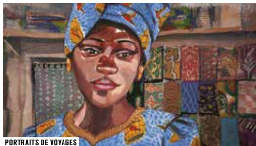
PORTRAITS DE VOYAGES

Fr. série animée 2013 coul. 18 x 3min. 1h10 (vidéo) voir p.47