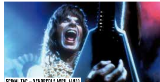
SPINAL TAP — VENDREDI 5 AVRIL, 14H30

« Nous étions jeunes et larges d'épaules, bandits joyeux, insolents et drôles, on attendait que la mort nous frôle, on the road again », chantait Bernard Lavilliers en 1988, reprenant le titre d'un morceau mythique dans lequel, vingt ans plus tôt, le groupe de blues rock Canned Heat exaltait les vertus de « la route ». Le temps a passé, les routards se sont fixés, mais les groupes ont continué à donner des concerts de ville en ville. On the road again , ou quand un mode de vie, celui des musiciens en tournée, rejoint un genre cinématographique, le road movie: l'image des artistes on tour dans leur bus avec « arrêts groupies » était trop belle pour que le cinéma n'en fasse pas son miel. Dans The Rose , les concerts donnés par l'héroïne inspirée de Janis Joplin sont des moments de communion grandioses. Susie et les Baker Boys ou Leningrad Cowboys montrent plutôt l'envers du décor: des musiciens hésitants, des salles vides, de petits moyens. Les documentaristes suivent les artistes en tournée, au Chili ( Réverbération ), aux États-Unis ( Gypsy Caravan ), en Europe ( Anvil ) ou « pour de faux », dans une hilarante parodie de documentaire musical ( Spinal Tap ).