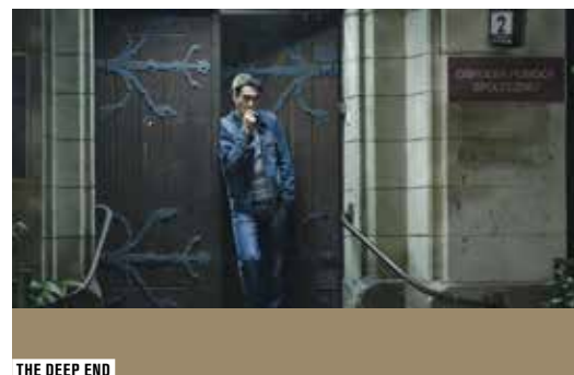
THE DEEP END

En Salle des collections, les accrédités ont accès à une sélection élargie de 60 séries en provenance du monde entier. Autre nouveauté : du 24 au 26 avril, le premier Forum de coproduction de séries télévisées européennes, soutenu par le programme MEDIA, organise des rencontres avec de potentiels cofinanceurs (producteurs et représentants de chaînes TV) autour de cinq porteurs de projets de nouvelles séries européennes.