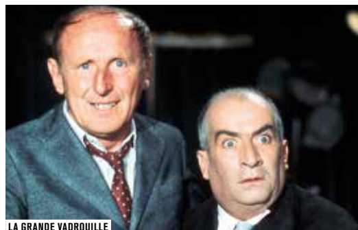
LA GRANDE VADROUILLE