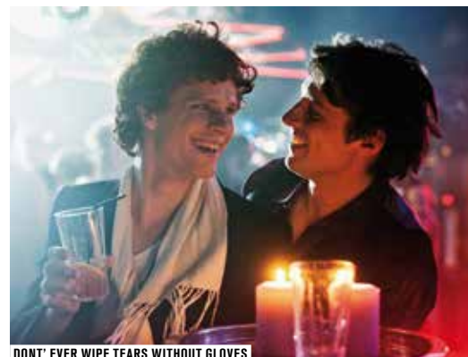
DONT' EVER WIPE TEARS WITHOUT GLOVES

Véritables défis de spectateurs, les intégrales sont des moments festifs et collectifs de partage de la passion des séries, dans une configuration exceptionnelle où elles sont déployées sur grand écran en salle de cinéma ! Après les folles nuits des intégrales True Blood et The Walking Dead au cours des précédentes éditions, Séries Mania propose pour sa saison 4 de nouvelles immersions complètes dans des séries...à découvrir dans le programme définitif.