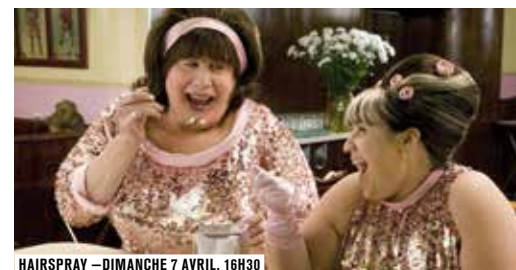
HAIRSPRAY — DIMANCHE 7 AVRIL, 16H30

On l'a découvert, chemise ouverte et pantalon cintré, en roi de la piste d'un dancing de Brooklyn, et retrouvé un an plus tard, blouson noir et