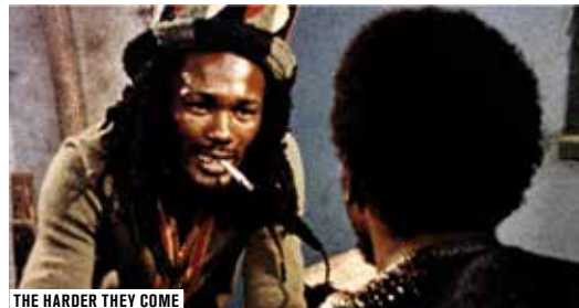
THE HARDER THEY COME

Des cours de cinéma ponctués d'extraits de films pour approfondir en compagnie de spécialistes, cinéphiles autant que mélomanes, films et figures emblématiques des thèmes développés dans le cycle En avant la musique! Celui proposé dans le cadre du festival Séries Mania revient sur Six Feet Under .