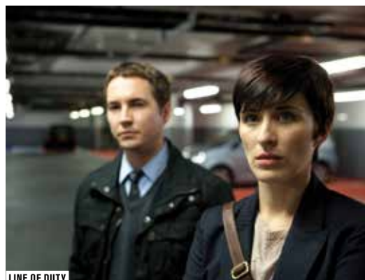
LINE OF DUTY