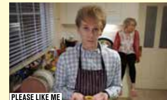
PLEASE LIKE ME

ENTRÉE LIBRE DANS LA LIMITE DES PLACES DISPONIBLES.