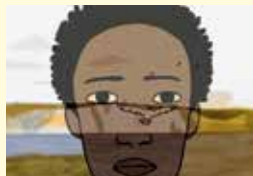
AL HURRIYA-FREEDOM LIBERTÉ

Divers anim. 2016-2017 coul. et n&b 1h40 (cin. num.)