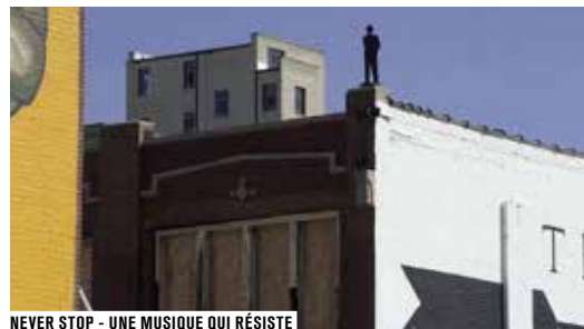
NEVER STOP - UNE MUSIQUE QUI RÉSISTE