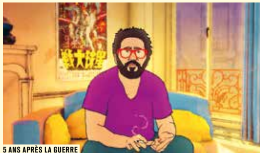
5 ANS APRÈS LA GUERRE

À l'école primaire, Shoya harcelait la petite Shoko à cause de son handicap auditif. Plusieurs années après, pris de remords, il tente de retrouver la jeune fille pour lui présenter ses excuses. Premier long métrage émouvant d'une jeune réalisatrice qui a déjà fait preuve de son talent à la télévision ( Tamako Market, K-On ! ).