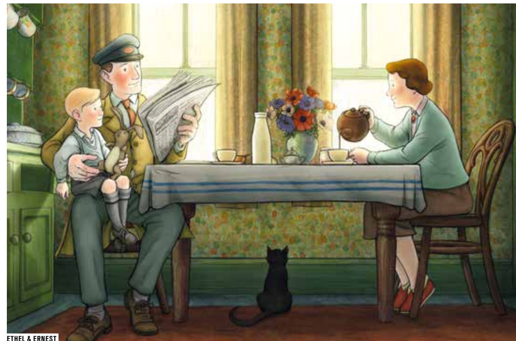
ETHEL & ERNEST