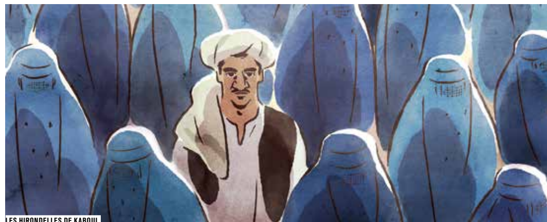
LES HIRONDELLES DE KABOUL