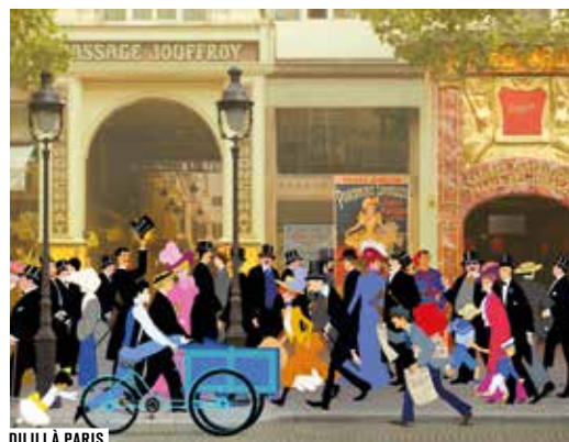
DILILI À PARIS