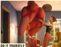
DO IT YOURSELF

Les réalisations des étudiants des écoles d'animation françaises ne cessent d'étonner. En voici un aperçu, réparti en quatre panoramas qui révéleront peut-être les grands noms du cinéma d'animation de demain.