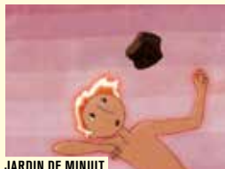
JARDIN DE MINUIT

France anim. 2017 coul. et n&b 1h26 (cin. num.)