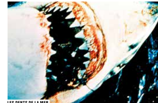
LES DENTS DE LA MER

« Passer en revue quatre décennies de blockbusters pour en identifier les inspirations, les courants et les évolutions n'est pas une mission aisée ! La rédaction des Fiches du cinéma a relevé ce défi à travers un ouvrage, « Les Sortilèges du blockbuster ».