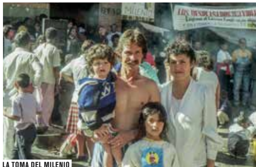
LA TOMA DEL MILENIO

Icône du cinéma engagé des années 1960 et 1970, Marta Rodríguez a construit l'une des œuvres les plus vastes et les plus riches du cinéma colombien. Son travail cinématographique, ininterrompu depuis plus de 50 ans, prend corps à l'intérieur des communautés indigènes, paysannes et ouvrières. Marchant main dans la main avec ceux qu'elles filment, associée à leurs luttes et leurs revendications, ses documentaires offrent un témoignage unique sur les peuples et communautés colombiennes victimes du conflit armé, de l'oppression et de l'indifférence. De son abondante filmographie, cinq films réalisés entre la fin des années 1960 et 2015, dont trois d'entre eux sont le fruit d'un travail commun avec son mari, le grand photographe Jorge Silva, décédé en 1988, constitue l'hommage qui lui est rendu.