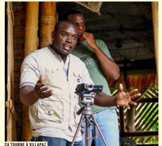
ÇA TOURNE À VILLAPAZ

Le destin d'une famille de la classe moyenne de Cali, victime de la crise économique. Nombre d'entre eux ont été condamnés à l'exil. Ceux qui restent, ruinés et isolés, doivent se battre pour continuer à vivre. Cette cellule familiale éclatée est celle de la réalisatrice. Installée en France depuis plusieurs années, elle va à la rencontre des siens, recueille leur parole, retrace leur parcours. Rien ne sera plus comme avant.