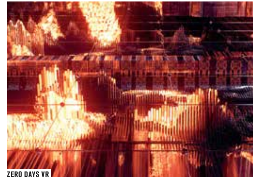
ZERO DAYS VR

C'est d sormais le pli   prendre : chaque samedi, le Forum des images, Diversion cinema et VRROOM pimentent votre week-end avec Les Samedis de la VR , LE rendez-vous parisien 100% cin philo-virtuel.