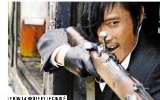
LE BON LA BRUTE ET LE CINGLÉ

Entre hommage et parodie, deux westerns revisitent avec brio les codes du genre. Mon nom est personne orchestre la savoureuse rencontre d'un jeune virtuose de la gâchette incarné par Terence Hill et une légende de l'ouest fatiguée, Henry Fonda, qu'il voudrait remettre en selle... Ovni coréen, Le Bon la brute et le cinglé transpose en Mandchourie la célèbre chasse au trésor de Sergio Leone et ses trois prétendants dans un exercice de style spectaculaire et déjanté. Culte !