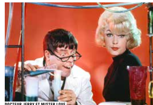
DOCTEUR JERRY ET MISTER LOVE

La scène se passe à Hollywood. Jim Carrey s'apprête à remettre un oscar d'honneur à Blake Edwards, lorsque celui-ci surgit des coulisses, cheveux blancs et jambe dans le plâtre sur un fauteuil roulant débridé qui traverse la scène en trombe, devant l'assistance médusée, et vient s'écraser à grand fracas dans le décor qui vole en éclat. Si le cinéaste et l'acteur réunis à l'occasion de ce sketch hilarant n'ont jamais tourné ensemble, ils partagent à l'évidence le goût du jeu et du dérèglement qui peut mener à la destruction... The Mask et Disjoncté offrent à Jim Carrey matière à de spectaculaires dédoublements, mimiques et transformations, dignes d'un Peter Sellers ou de Jerry Lewis dont il revendique l'influence. « I am because he was. » a-t-il écrit à l'annonce de sa mort, l'été dernier. Ne manquez pas Docteur Jerry et Mister Love , Artistes et modèles et Le Tombeur de ces dames pour saluer ce roi de la comédie.