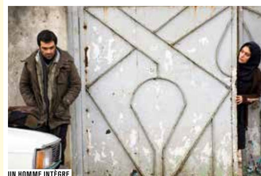
UN HOMME INTÈGRE

Regarder, apprendre et comprendre par le cinéma de fiction ce que vivent les hommes au-delà de notre périmètre habituel, tel est l'ambition d' Un état du monde . Un festival qui réunit, sous le regard croisé de cinéastes et de personnalités du monde entier, des films récents sur des questions politiques, sociales ou géopolitiques. Œuvres inédites et avant-premières, rétrospectives, invités et sections thématiques composent cette 9 e édition.