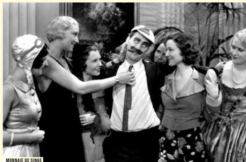
MONNAIE DE SINGE

21H LES INCASSABLES ARTISTES ET MODÈLES (ARTISTS AND MODELS) DE FRANK TASHLIN AVEC JERRY LEWIS, DEAN MARTIN, SHIRLEY MACLAINE États-Unis fict. vostf 1955 coul. 1h49 (cin. num.) Amis fidèles et sans le sou, Rick et Eugène tentent de percer à New York. Le premier est dessinateur, le second rêve d'écrire des histoires... Apogée du tandem Jerry Lewis-Dean Martin, une comédie farfelue de Frank Tashlin, avec une délicieuse Shirley McLaine. PRÉCÉDÉ D'UN CARTOON SURPRISE