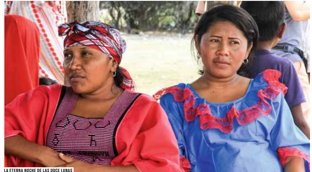
LA ETERNA NOCHE DE LAS DOCE LUNAS