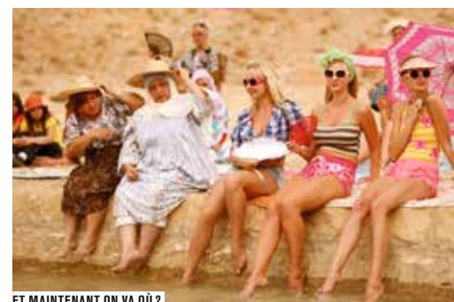
ET MAINTENANT ON VA OÙ ?