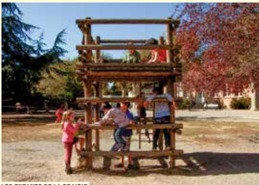
LES ENFANTS DE LA PRAIRIE

Grand prix plus de 40 minutes - FIGRA 2016