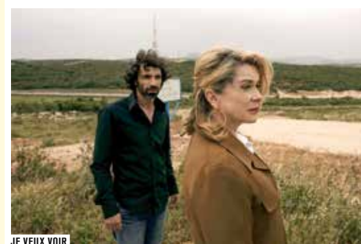
JE VEUX VOIR