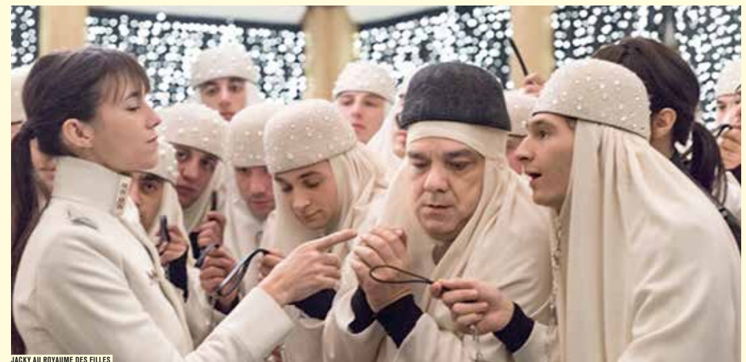
JACKY AU ROYAUME DES FILLES