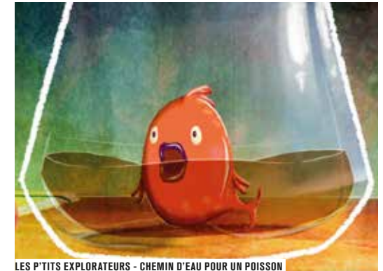
LES P'TITS EXPLORATEURS - CHEMIN D'EAU POUR UN POISSON