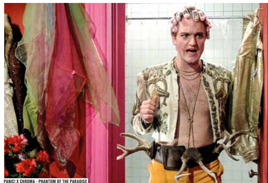
PANIC! X CHROMA - PHANTOM OF THE PARADISE

Un sentiment de liberté, que l'on retrouve dans ses films parisiens à voir en Salle des collections. Prévert était un rebelle, intransigeant, et ses mots résonnent aujourd'hui avec nos préoccupations contemporaines. Derrière les répliques célèbres des Enfants du paradis et du Jour se lève , ou des films rarissimes comme Les Primitifs du XIII e (Prix du jury Venise 1960), le poète se révèle en vrai cancre, dans le sens noble du terme : il chahute, il dérange. Toujours avec la formule qui fait mouche : « Tout ce qu'il y a de beau à Paris, peut-être qu'on pourrait le transporter à la campagne ? » ▶