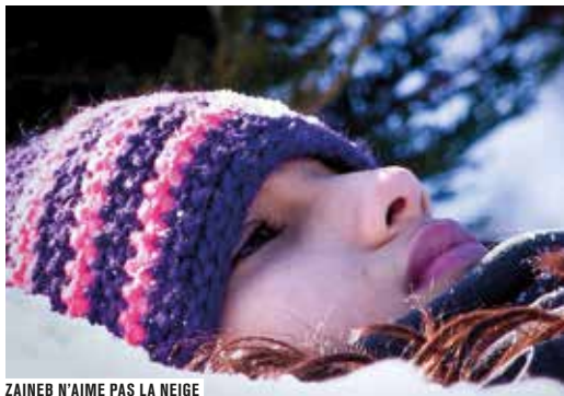
ZAINEB N'AIME PAS LA NEIGE

KAOUTHER BEN HANIA, UNE CINÉASTE CULOTTÉE MARDI 4 AVRIL À 19H ET 21H