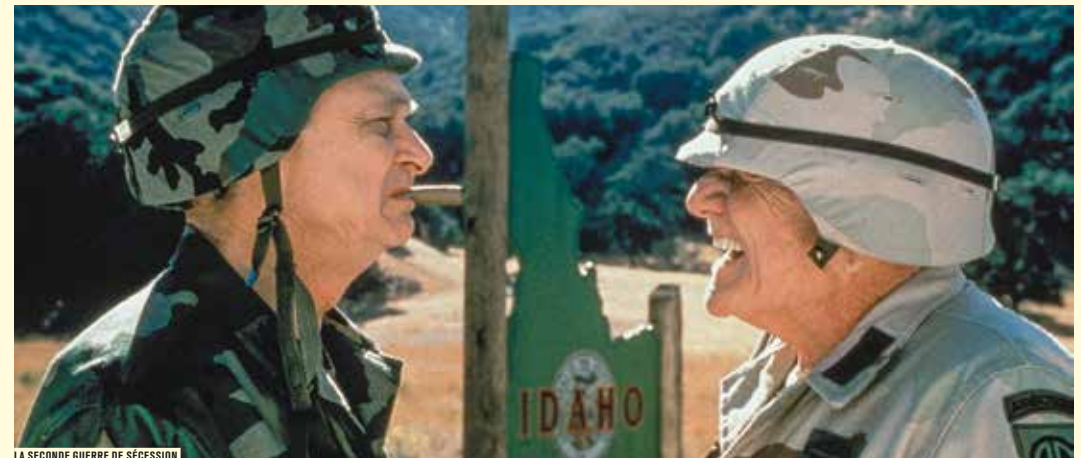
LA SECONDE GUERRE DE SÉCESSION

Le Hot club quintet de France interprète « J'attendrai ». Django Reinhardt fait courir ses doigts sur sa guitare en compagnie de Stéphane Grappelli et des autres musiciens aux meilleurs moments du Quintette du Hot Club de France.