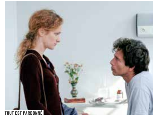
TOUT EST PARDONNÉ