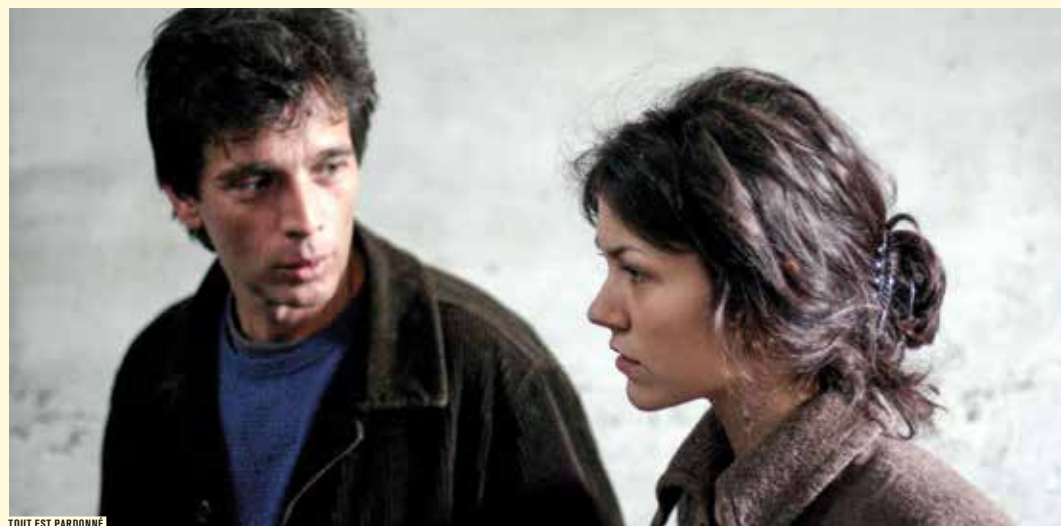
TOUT EST PARDONNÉ