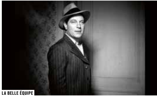
LA BELLE ÉQUIPE

Le Petit Bain, équipement culturel flottant sur les quais de Seine du 13 e arrondissement de Paris, accompagne la projection de La Belle Équipe de Julien Duvivier, le film emblématique du Front populaire. Lever de rideau avec un « karatoké » des chants de lutte les plus caractéristiques de l'époque, puis la séance est suivie d'un bal mené par DJ Mère grand.