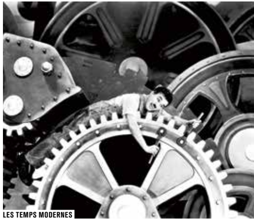
LES TEMPS MODERNES

De l'Union soviétique proviennent des films qui galvanisent les militants cinéphiles pour les luttes à venir: Les Marins de Kronstadt d'Efim Dzigan; La Jeunesse de Maxime de Grigori Kozintsev et Leonid Trauberg, qui influencera Renoir pour Les Bas-fonds .