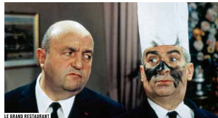
LE GRAND RESTAURANT