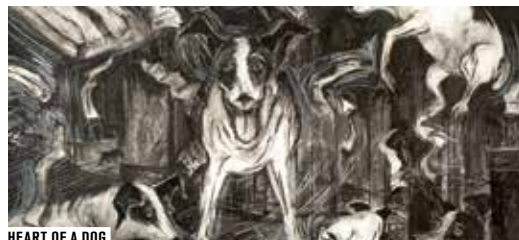
HEART OF A DOG

Il a été l'âme de la Lucarne sur Arte pendant près de 20 ans, constituant un ébouriffant répertoire documentaire dans lequel il a pioché pour nous trois pépites signées Naomi Kawase, Alain Cavalier et Laurie Anderson.