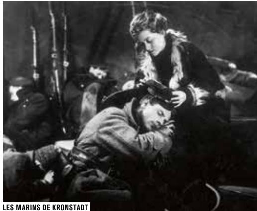
LES MARINS DE KRONSTADT