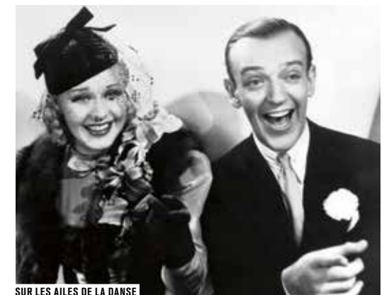
SUR LES AILES DE LA DANSE

SAMEDI 21 MAI À 19H ET DIMANCHE 22 MAI À 16H30 VOIR P. 28