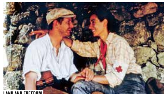
LAND AND FREEDOM