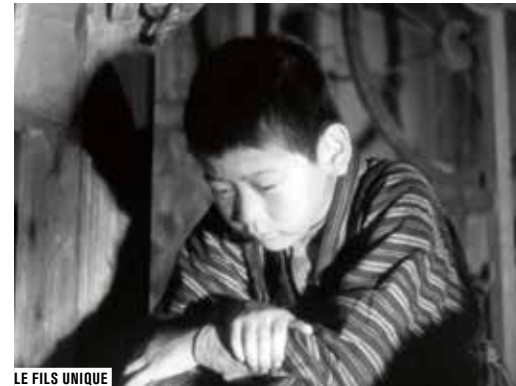
LE FILS UNIQUE

Si Pagnol arrive en tête du box-office en France pour cette année 1936, les critiques de l'époque n'oublient pas de célébrer la beauté du premier film parlant de Yasujiro Ozu ( Le Fils unique ), la virtuosité joyeuse des claquettes de Fred Astaire et Ginger Rogers ( Sur les ailes de la danse ), les marivaudages spirituels de Sacha Guitry ( Faisons un rêve ). 1936, c'est bien évidemment l'année de Jean Gabin qui incarne l'ouvrier des faubourgs ( La Belle Équipe , Les Bas-fonds , Pépé le Moko ), de la grande Françoise Rosay ( La Kermesse héroïque , Jenny ) et de la belle Marlene Dietrich ( Désir ).