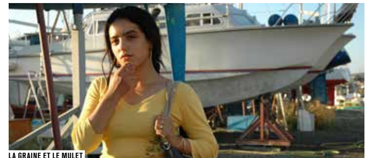
LA GRAINE ET LE MULET