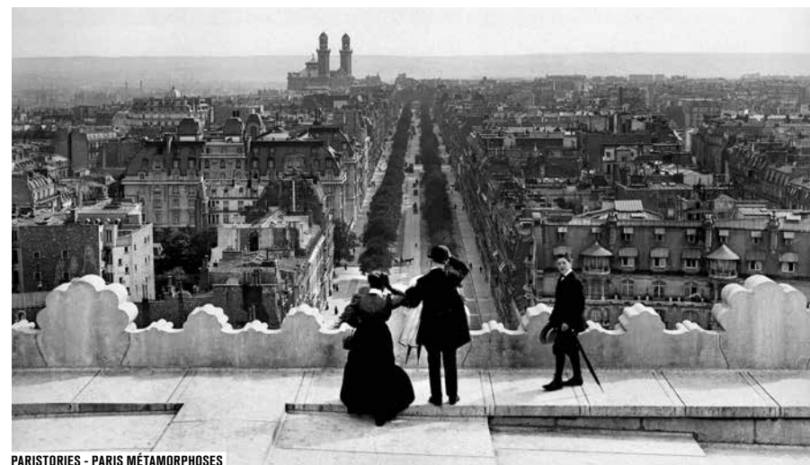
PARISTORIES - PARIS MÉTAMORPHOSES

Le Forum des images aime rendre hommage à la capitale. Trois expositions virtuelles, réalisées en partenariat avec le Google Cultural Institute, permettent à des films et photographies anciennes de Paris, amateurs ▶