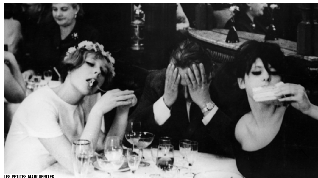
LES PETITES MARGUERITES