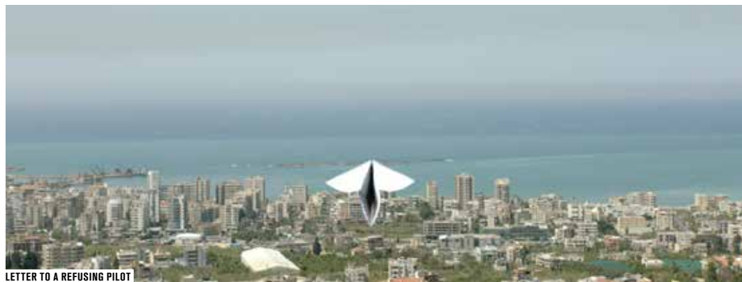
LETTER TO A REFUSING PILOT