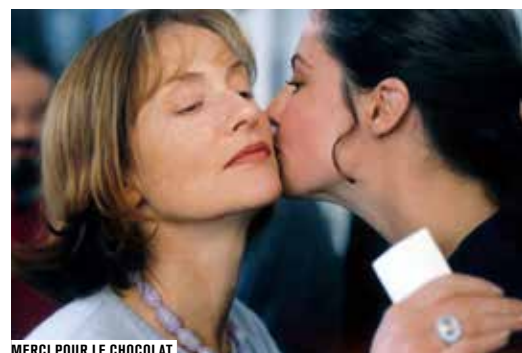
MERCI POUR LE CHOCOLAT