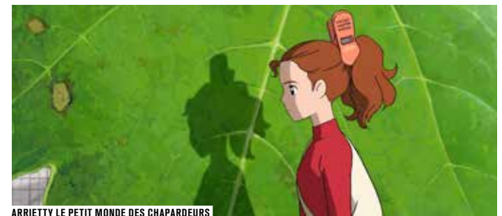
ARRIETTY LE PETIT MONDE DES CHAPARDEURS