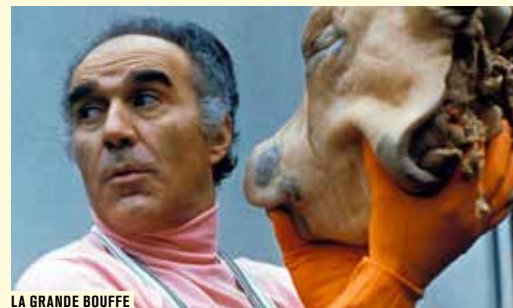
LA GRANDE BOUFFE

(LA GRANDE ABBUFFATA) DE MARCO FERRERI AVEC MARCELLO MASTROIANNI, PHILIPPE NOIRET It.-Fr. fict. vostf 1973 coul. 2h05 (35mm) Quatre bourgeois en mal de sensation se retirent dans une villa pour une orgie gastronomique où il s'agit de manger jusqu'à en mourir. « Nous tendions un miroir aux gens et ils n'ont pas aimé se voir dedans », dira plus tard Philippe Noiret de cette farce féroce qui a fait scandale au Festival de Cannes. Certaines scènes de cette œuvre peuvent heurter la sensibilité de certains spectateurs, notamment les plus jeunes FILM REPROGRAMMÉ SAM. 5 MARS À 21H