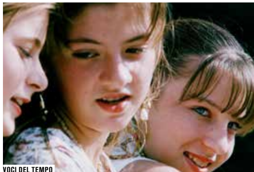
VOCI DEL TEMPO

Né en Lombardie en 1933 dans la Province de Brescia, Franco Piavoli est une figure majeure du cinéma indépendant en Italie. Produisant ses propres films, faisant de sa terre natale la nature de son œuvre, son cinéma a marqué des réalisateurs aussi différents qu'Andreï Tarkovski, Bernardo Bertolucci, Godfrey Reggio ou Stan Brakhage. Cinéma du réel est fier de présenter en France la première rétrospective intégrale de l'œuvre de ce poète à la caméra. L'œuvre de Piavoli reste cependant, et malgré ses qualités, méconnue. L'esprit indépendant et le caractère réservé de son auteur y ont sans doute contribué. De longues années séparent les longs métrages de cet artisan du cinéma : après Il pianeta azzurro en 1982, Nostos date de 1989, Voci nel tempo de 1996 et Al primo soffio di vento de 2002. Piavoli n'a jamais voulu s'éloigner de ses lieux de prédilection, de la province de Brescia, notamment de son village, Pozzolengo et de ses collines. Autant de territoires qui sont la nourriture, la sève de presque tous ses films.