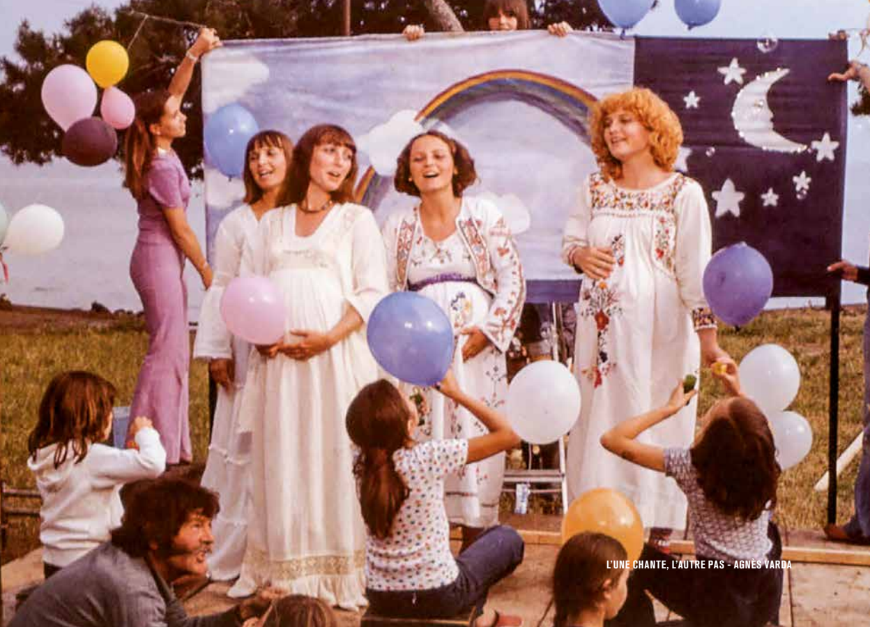
L'UNE CHANTE, L'AUTRE PAS - AGNÈS VARDA