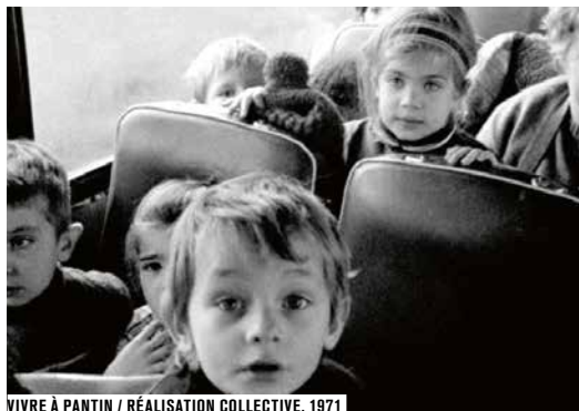
VIVRE À PANTIN / RÉALISATION COLLECTIVE, 1971