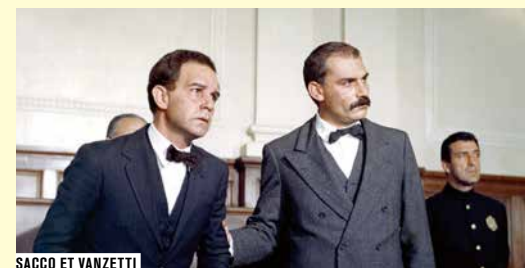
SACCO ET VANZETTI

Beyrouth 1975. Larbi Nasri, un jeune journaliste algérien, est pris dans le tourbillon des événements qui précèdent la guerre civile. Il est lié à Nahla, jeune chanteuse, autour de laquelle gravite une série de personnages dont les relations sont envenimées par les espoirs déçus.