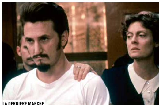
LA DERNIÈRE MARCHÉ