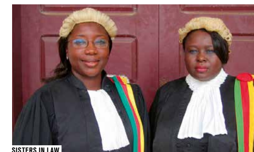
SISTERS IN LAW

ENTRÉE LIBRE DANS LA LIMITE DES PLACES DISPONIBLES