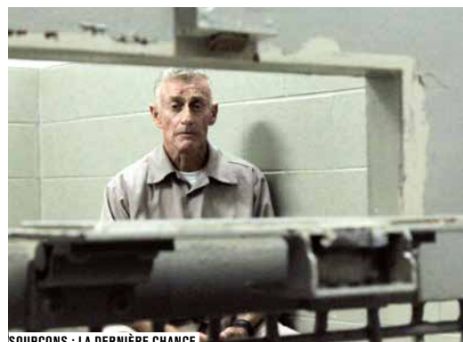
SOUPÇONS : LA DERNIÈRE CHANCE

« Parce que le droit, c'est toujours des histoires ! » (1) , la justice est le terrain de choix de Jean-Xavier de Lestrade. Avec, dans la tête, une idée fixe : filmer la vie des gens. Prix Albert Londres, La Justice des hommes (2000) suit le travail d'une avocate d'Avocats sans frontières, qui défend au Rwanda des hommes jugés pour génocide. Un coupable idéal , oscarisé en 2002, suit le procès de Brenton Butler, un adolescent noir accusé du meurtre d'une touriste blanche en Floride, défendu par un avocat commis d'office, qui crève l'écran. Le documentariste y affine sa méthode : décortiquer la machine judiciaire, avec le temps comme allié, et la confiance de ceux qu'il filme. Dix ans après sa série documentaire Soupçons , Jean-Xavier de Lestrade retrouve l'écrivain Michael Peterson, condamné à perpétuité pour le meurtre de sa femme, pour un nouveau procès en appel et un autre thriller judiciaire ( Soupçons : la dernière chance ). Ces documentaires sont à voir dans ce cycle.