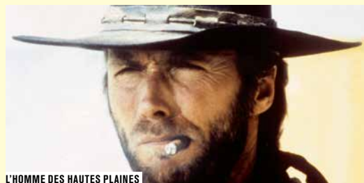
L'HOMME DES HAUTES PLAINES

(THE SEARCHERS) DE JOHN FORD AVEC JOHN WAYNE, JEFFREY HUNTER É.-U. fict. vostf 1956 coul. 1h59 (cin. num.) Pendant des années, Ethan poursuit les Comanches qui ont enlevé ses nièces. Premier film pessimiste de John Ford, La Prisonnière est aussi l'une de ses rares œuvres centrées sur un personnage solitaire et tragique. John Wayne est bouleversant en antihéros amer et violent, mû par une haine névrotique des Indiens.