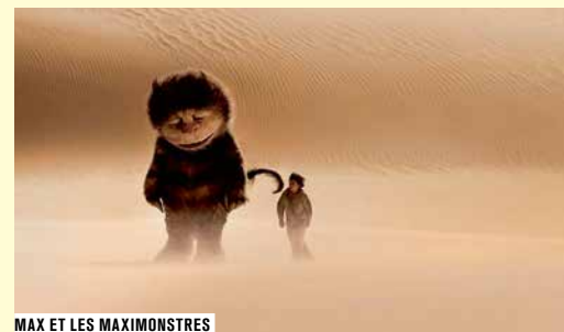
MAX ET LES MAXIMONSTRES

É.-U. fict. vf 2009 coul. 1h42 (cin. num.) Le jeune Max fugue et se retrouve dans un pays étrange habité par d'immenses créatures qui le couronnent roi. En s'amusant à gouverner, Max découvre que le jeu recèle bien des pouvoirs... Un film profond et mélancolique sur la solitude enfantine.