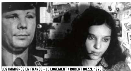
LES IMMIGRÉS EN FRANCE - LE LOGEMENT / ROBERT BOZZI, 1970

Ciné-Archives collecte, conserve et valorise le patrimoine audiovisuel du Parti communiste français et du mouvement ouvrier et démocratique. Plus de 300 titres sont consultables en Salle des collections du Forum des images, et reflètent l'histoire du XX e siècle par le prisme communiste.