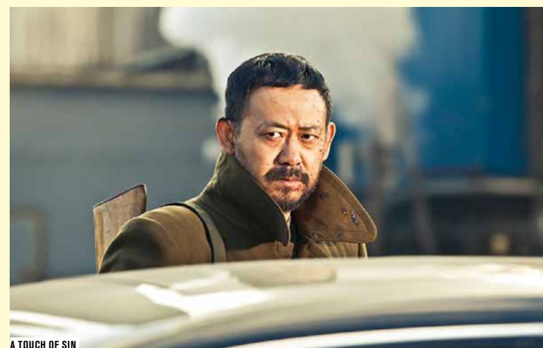
A TOUCH OF SIN