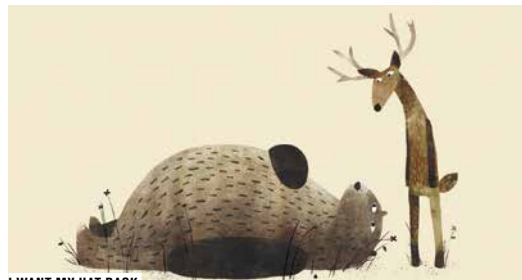
I WANT MY HAT BACK