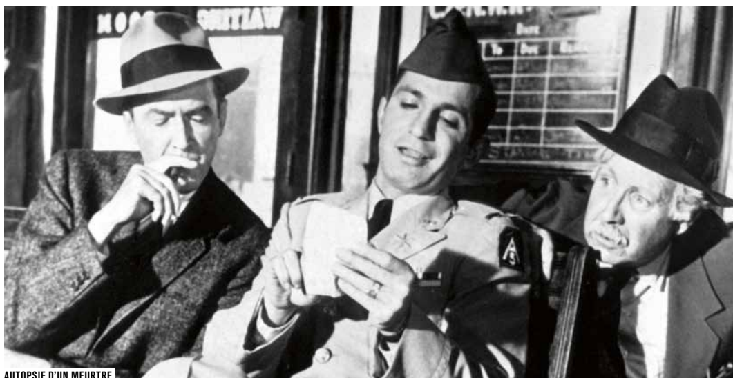
AUTOPSIE D'UN MEURTRE

ENTRÉE LIBRE DANS LA LIMITE DES PLACES DISPONIBLES