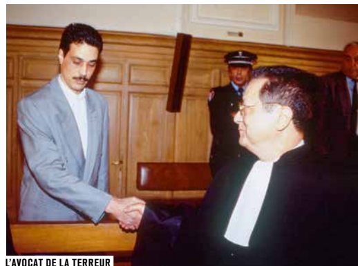
L'AVOCAT DE LA TERREUR

Machine sans âme ou fragile construction humaine ? L'institution judiciaire n'est pas uniquement une mécanique bien huilée, mais le cadre complexe au sein duquel évoluent divers acteurs. Il y a ceux qui apprennent à rendre la justice ( La Fabrique des juges de Julie Bertuccelli), des avocats plus ou moins scrupuleux sur la vérité ( L'Avocat de la terreur de Schroeder, Le Procès Paradine de Hitchcock), des citoyens qui font leur devoir ( 12 hommes en colère de Lumet) ou se retrouvent sur le banc des accusés ( Délits flagrants de Depardon, L'Ivresse du pouvoir de Chabrol). Le tribunal devient le théâtre de scènes parfois hilarantes ( Madame porte la culotte de Cukor) ou dramatiques ( Prud'hommes de Stéphane Goël). Car, à travers les affaires judiciaires, réelles ou fictives, c'est bien le portrait d'un monde et d'une société qui apparaît.