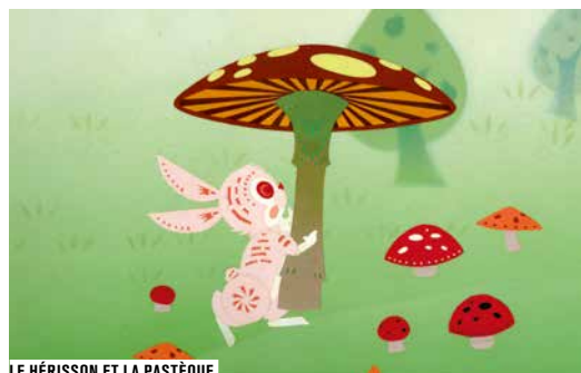
LE HÉRISSON ET LA PASTÈQUE