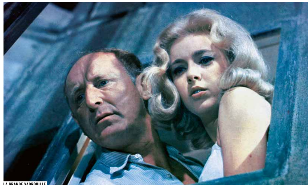
LA GRANDE VADROUILLE

Paris, ville lumière, ville cinéma, a inspiré des milliers de films. Autour d'un réalisateur, d'un acteur, d'un quartier, d'une époque ou d'un thème, Cinéma ville propose chaque mois une exploration de ce qui palpite dans la cité.