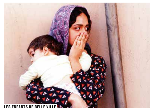
LES ENFANTS DE BELLE VILLE