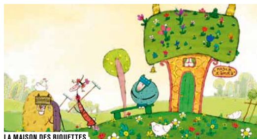
LA MAISON DES BIQUETTES