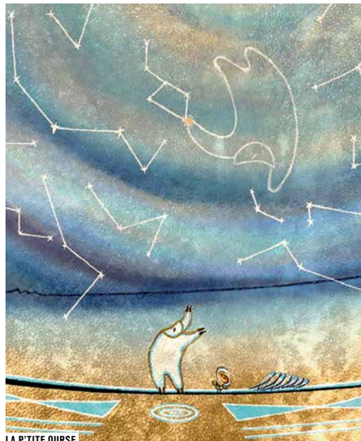
LA P'TITE OURSE