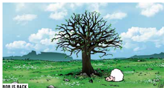
BOB IS BACK