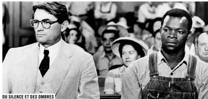
DU SILENCE ET DES OMBRES