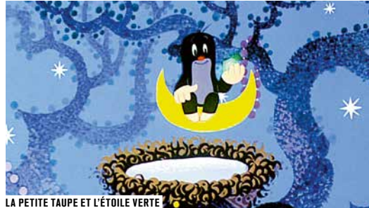
LA PETITE TAUPE ET L'ÉTOILE VERTE

Chanteur-compositeur, Florent Marchet s'impose avec des sons cosmiques et des explosions synthétiques. Orfèvre de la chanson française, il réalise des morceaux subtils et attachants. Son nouveau défi : créer une musique originale pour les plus petits sur des films où étoiles, nuit et planètes se mêlent subtilement, en invitation à une balade cosmique pop rock.