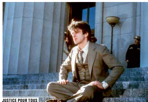
JUSTICE POUR TOUS

La justice a été donnée aux hommes, afin de leur permettre de vivre ensemble dans la cité. Parce qu'humaine, la justice est faillible, l'ordre est alors remis en cause par l'institution même