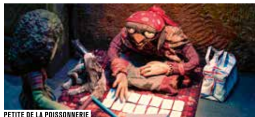
PETITE DE LA POISSONNERIE