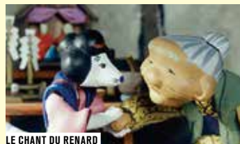
LE CHANT DU RENARD