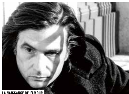
LA NAISSANCE DE L'AMOUR

OFFREZ UN AN DE CINÉMA AVEC LA CARTE FORUM ILLIMITÉ