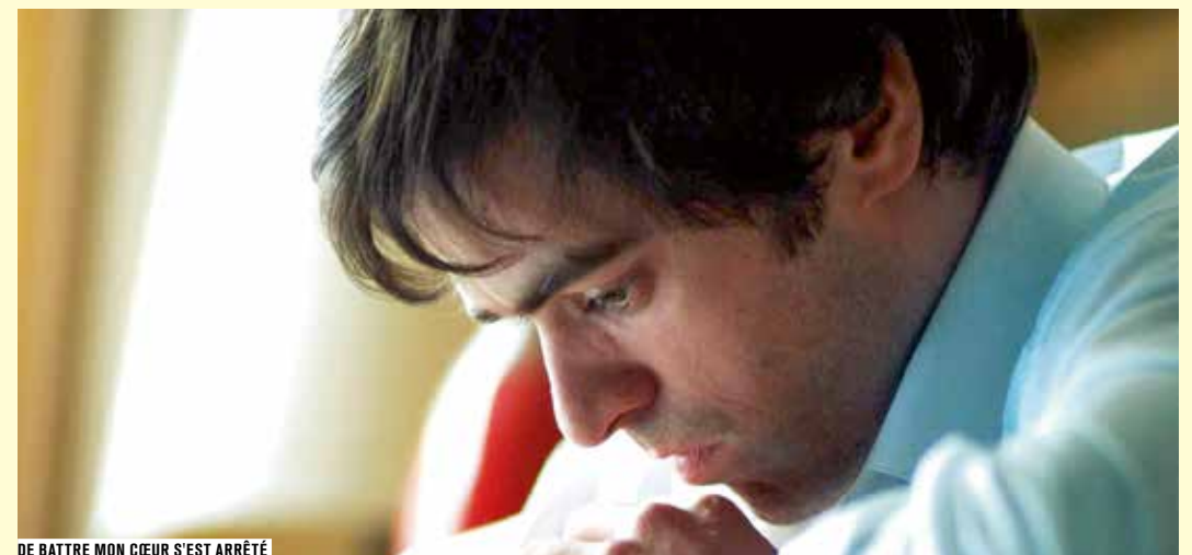
DE BATTRE MON CŒUR S'EST ARRÊTÉ

Tom semble suivre les traces de son père dans l'immobilier véreux. Mais une rencontre fortuite le pousse à rêver de la carrière de pianiste concertiste qu'exerçait sa mère de son vivant. « Un film multiple [...] croisant polar, roman d'éducation, photographie d'une époque, reportage sur un acteur, éloge de la musique et transe œdipienne. » (Didier Péron, Libération )