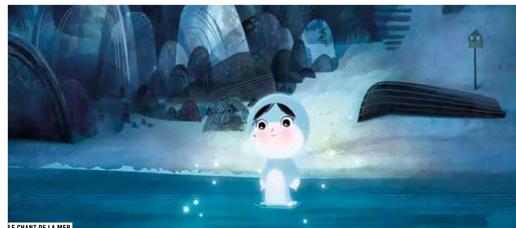
LE CHANT DE LA MER