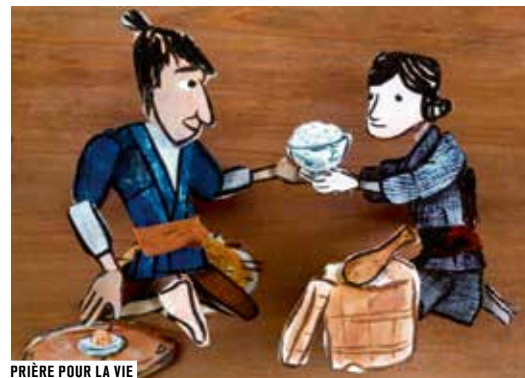
PRIÈRE POUR LA VIE

La créativité contemporaine se nourrit des œuvres du passé, d'où la nécessité de mettre en perspective nouveautés et patrimoine. Cette année, un nouveau Retour de Flamme avec son lot de pépites du cinéma d'animation dénichées et mises en musique par le maestro Serge Bromberg. Par ailleurs, Ilan NGuyên, spécialiste du cinéma d'animation japonais, présente une rétrospective des films d'Okamoto Tanadari, grand cinéaste méconnu hors de son pays.