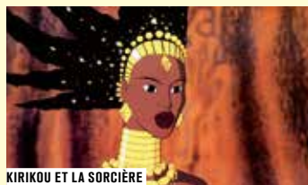
KIRIKOU ET LA SORCIÈRE

Cette carte blanche sur le thème « Érotisme animé » peut surprendre. Sauf quand on sait que Michel Ocelot a réalisé un film paillard, Les Quatre Vœux , et qu'il a depuis longtemps un projet de film érotique. Et de quel film est tiré le dialogue suivant : « N'allons pas tout de suite au village. — Non, c'est si doux... — Maintenant que tu es un homme, tu ne vas pas retourner au village tout nu, je vais orner ton corps » ?