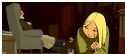
TOUT EN HAUT DU MONDE