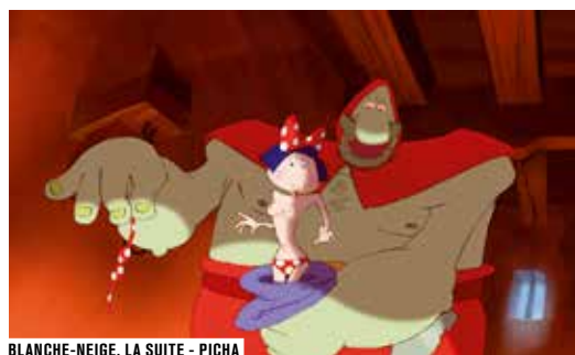
BLANCHE-NEIGE, LA SUITE - PICHA