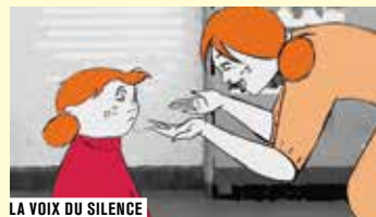
LA VOIX DU SILENCE

Originalité des histoires, diversité des techniques d'animation, cette sélection de films de fin d'études choisis par le Forum des images est un avant-goût des programmes Panorama qui présentent chaque année une sélection de films de fin d'études. L'occasion de découvrir les nouveaux talents des écoles d'animation françaises participantes!