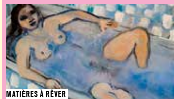
MATIÈRES À RÊVER