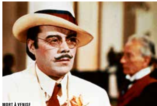
MORT À VENISE

Le Carrefour du cinéma d'animation s'intéresse à cette vague de longs métrages qui utilisent l'animation pour dire l'époque actuelle. Visconti et Friedkin ouvrent les cours du cycle Contamination .