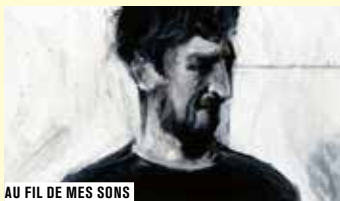
AU FIL DE MES SONS

2 e PARTIE FRANCE ANIM. 2014 COUL. 1H30 (VIDÉO)