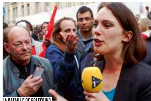
LA BATAILLE DE SOLFÉRINO