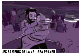
LES SAMEDIS DE LA VR - SEA PRAYER