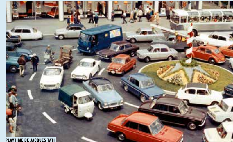
PLAYTIME DE JACQUES TATI

Apprendre à connaître et à aimer sa ville et son quartier pour mieux les valoriser : cette démarche revêt une dimension culturelle autant que sociale. Le Forum des images, situé au cœur du Grand Paris, à la jonction de grandes lignes de transports en commun, est le lieu idéal pour découvrir la capitale et explorer la ville autrement.