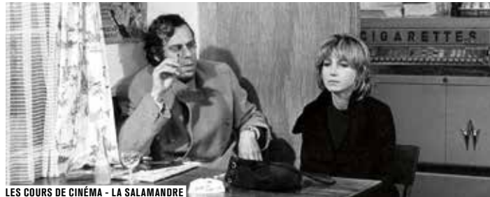
LES COURS DE CINÉMA - LA SALAMANDRE