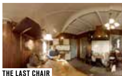
THE LAST CHAIR

Chaque semaine, vivez le cinéma en réalité virtuelle et profitez d'une expérience privilégiée ! AU PROGRAMME : THE LAST CHAIR - EGBERT, THE LAST CHAIR - FRED, SEA PRAYER, NOTES TO MY FATHER, VR FUNHOUSE, IRRATIONAL EXUBERANCE