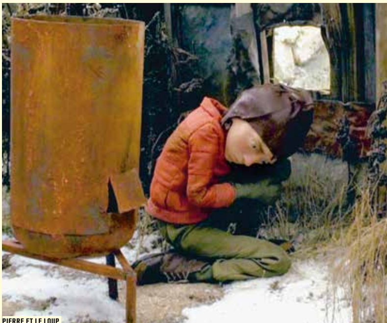
PIERRE ET LE LOUP