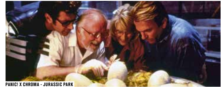
PANIC! X CHROMA - JURASSIC PARK

EN PARTENARIAT AVEC : DIVERSION CINEMA / VRRROOM / VIVRE PARIS / LE BONBON / ARTE / FRANCE INFO