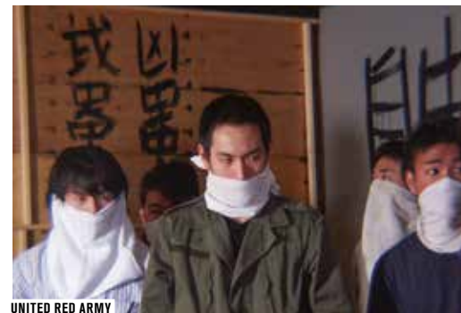
UNITED RED ARMY