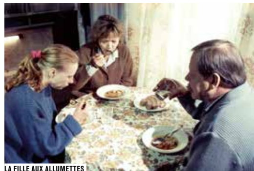
LA FILLE AUX ALLUMETTES

Rosemonde (dans Fourbi ) soupire : « L'école, l'apprentissage... Les gens, ils n'arrêtaient pas de m'emmerder. On tombe toujours sur un casse-couille, et puis ça ne marche pas : un prof, un patron, une patronne. » La norme est perpétuellement interrogée par le cinéma. Le grain de sable qui fait dérailler la mécanique et pousse à l'excès. « C'est un film qui questionne la norme », dit Justine Triet à propos de La Bataille de Solferino , qui filme les débordements d'une foule de militants et ceux, joyeusement dysfonctionnels, d'un couple séparé. Quand la coupe est pleine, on ne peut présumer de rien ! La jeune ouvrière de La Fille aux allumettes achète de la mort aux rats pour dégommer ses proches, la mère de famille Beverly ( Serial Mother ) sort son fusil si on la contrarie. Quant aux héros des Nouveaux Sauvages , mieux vaut ne pas les énerver !