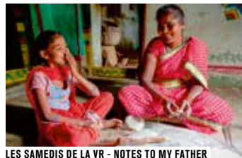
LES SAMEDIS DE LA VR - NOTES TO MY FATHER