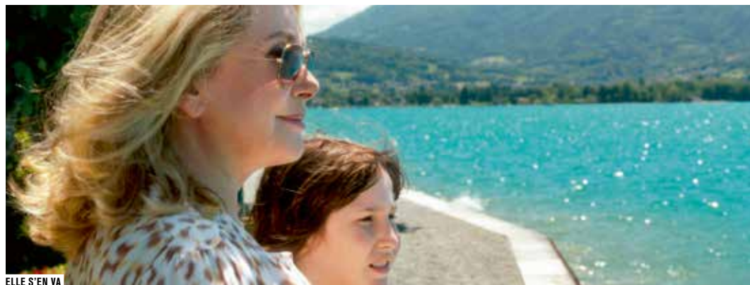
ELLE S'EN VA

• JURASSIC PARK DE STEVEN SPIELBERG États-Unis fict. vf 1993 coul. 2h07 (cin. num.) voir p.35