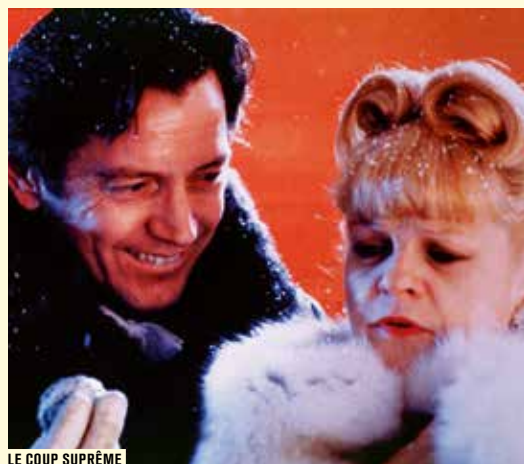
LE COUP SUPRÊME

Voir inscription p. 47 ÉGALEMENT PROPOSÉ DIM. 4 MARS À 14H30