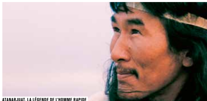
ATANARJUAT, LA LÉGENDE DE L'HOMME RAPIDE

• RENDEZ-VOUS À KIRUNA D'ANNA NOVIN France fict. 2012 coul. 1h37 (cin. num.) voir p.44