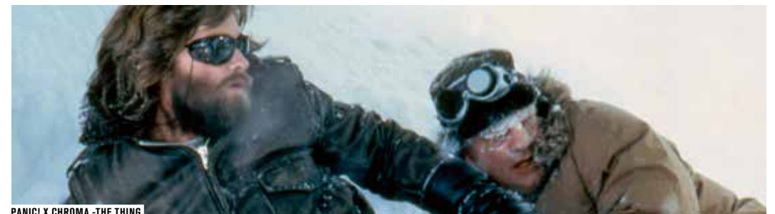
PANIC! X CHROMA - THE THING