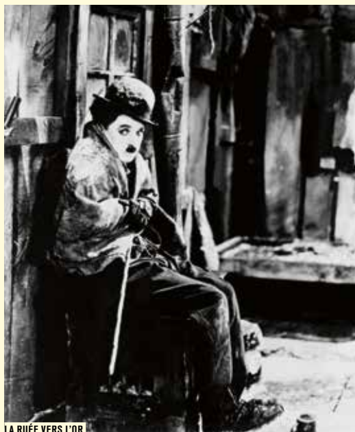
LA RUÉE VERS L'OR

DE DAGUR KARI AVEC TOMAS LEMARQUIS, THRÖSTUR LEO GUNNARSSON Dan.-Isl.-All. fict. vostf 2003 coul. 1h33 (35mm) VOIR RÉSUMÉ P.34