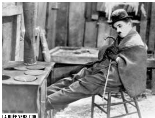
LA RUÉE VERS L'OR