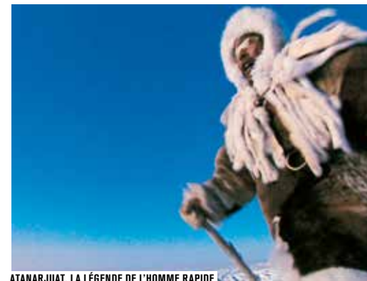
ATANARJUAT, LA LÉGENDE DE L'HOMME RAPIDE

Zacharias Kunuk vit à Igloolik dans le Nunavut, au Nord du Canada. Fils de chasseur, il est entré en trombe dans le milieu du cinéma. En 2001, son film Atanarjuat, la légende de l'homme rapide , premier film entièrement tourné en inuktitut, a reçu la Caméra d'or au Festival de Cannes, attirant ainsi l'attention de la communauté cinéphile internationale sur celle du peuple inuit. Fondée en 1990 pour « accorder aux voix inuits le pouvoir de raconter leurs propres histoires », sa maison de production Isuma a permis l'éclosion de nombreux films.