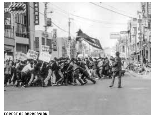
FOREST OF OPPRESSION

Le répertoire du cinéma documentaire français sur mai 68 est très largement connu et officiellement canonisé par des livres, des coffrets DVD, des diffusions télévisuelles et festives. Avec cette rétrospective, nous souhaitons élargir ce corpus et tenter de voir 68 comme une énergie de création davantage que comme un anniversaire à fêter rituellement : un kairos de l'histoire qui a irrigué le monde bien au-delà de l'Europe et du cinéma militant classique. Sortir de l'eurocentrisme, de l'idéologie et de la nostalgie, pour trouver dans la différence des perspectives et l'hybridation des langages les clefs d'une lecture non-orthodoxe d'un phénomène complexe et irréductible.