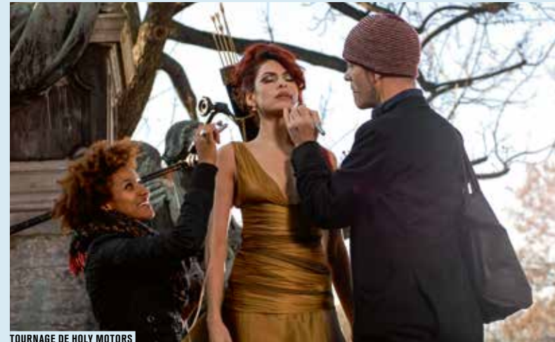
TOURNAGE DE HOLY MOTORS

Depuis sa création, le Forum des images est le partenaire de l'enseignement du cinéma en lycée, dans le cadre d'options obligatoires ou facultatives, ou en classe préparatoire littéraire. L'occasion pour les élèves d'une véritable immersion dans le 7 e art.