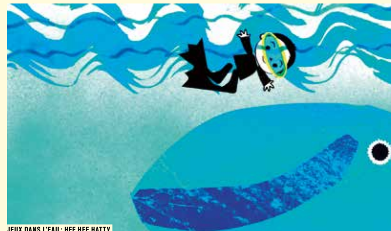
JEUX DANS L'EAU : HEE HEE HATTY