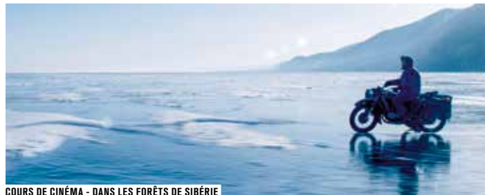
COURS DE CINÉMA - DANS LES FORÊTS DE SIBÉRIE