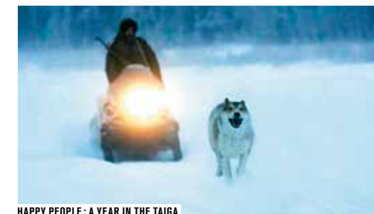
HAPPY PEOPLE: A YEAR IN THE TAIGA