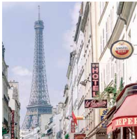
Détail des séances sur forumdesimages.fr