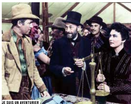
JE SUIS UN AVENTURIER

Dès le XIX e siècle, la découverte de gisements attire les chercheurs d'or dans le Klondike. Une épopée immortalisée très tôt par le cinéma. Charlie Chaplin, en 1929, filme avec humour et fantaisie cette Ruée vers l'or dans le Grand Nord canadien. Charlot, personnage solitaire et tragi-comique, qui cherche à échapper à la misère, donne une portée universelle à cette quête effrénée de la richesse. Tourné en décors naturels dans le Grand Nord canadien, Je suis un aventurier retrace cette longue marche des pionniers chercheurs d'or vers l'Alaska. En écho au film de Chaplin, Anthony Mann décrit aussi la cupidité des hommes. Splendeur visuelle d'un western qu'on peut qualifier de nordique, dont chaque vision constitue un bonheur ineffable.