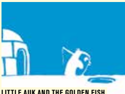
LITTLE AUK AND THE GOLDEN FISH

Une production Forum des images VOIR RÉSUMÉ CI-CONTRE