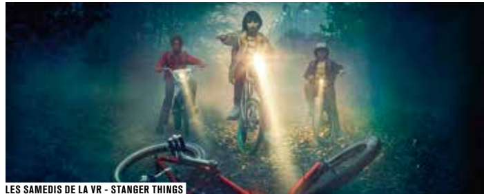
LES SAMEDIS DE LA VR - STANGER THINGS