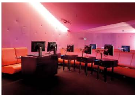
Le Petit Amphithéâtre

Dédiée à la consultation de documents numériques, la Salle des collections offre un confort optimum grâce à son ergonomie, son isolation sonore et son architecture. Ses postes informatiques peuvent être utilisés seul ou à deux, ses deux Petits Salons peuvent être privatisés, son Petit Amphithéâtre peut accueillir jusqu'à 32 personnes sur 16 postes. Sessions de formation, visionnage, ateliers..., notre service commercial est à votre disposition pour étudier tout projet.