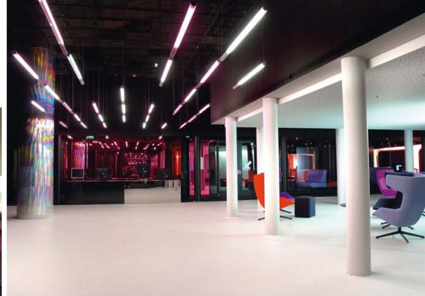
Le Grand Foyer