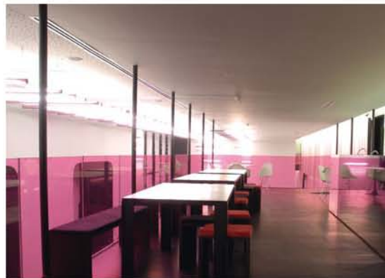
Le 7 e Bar