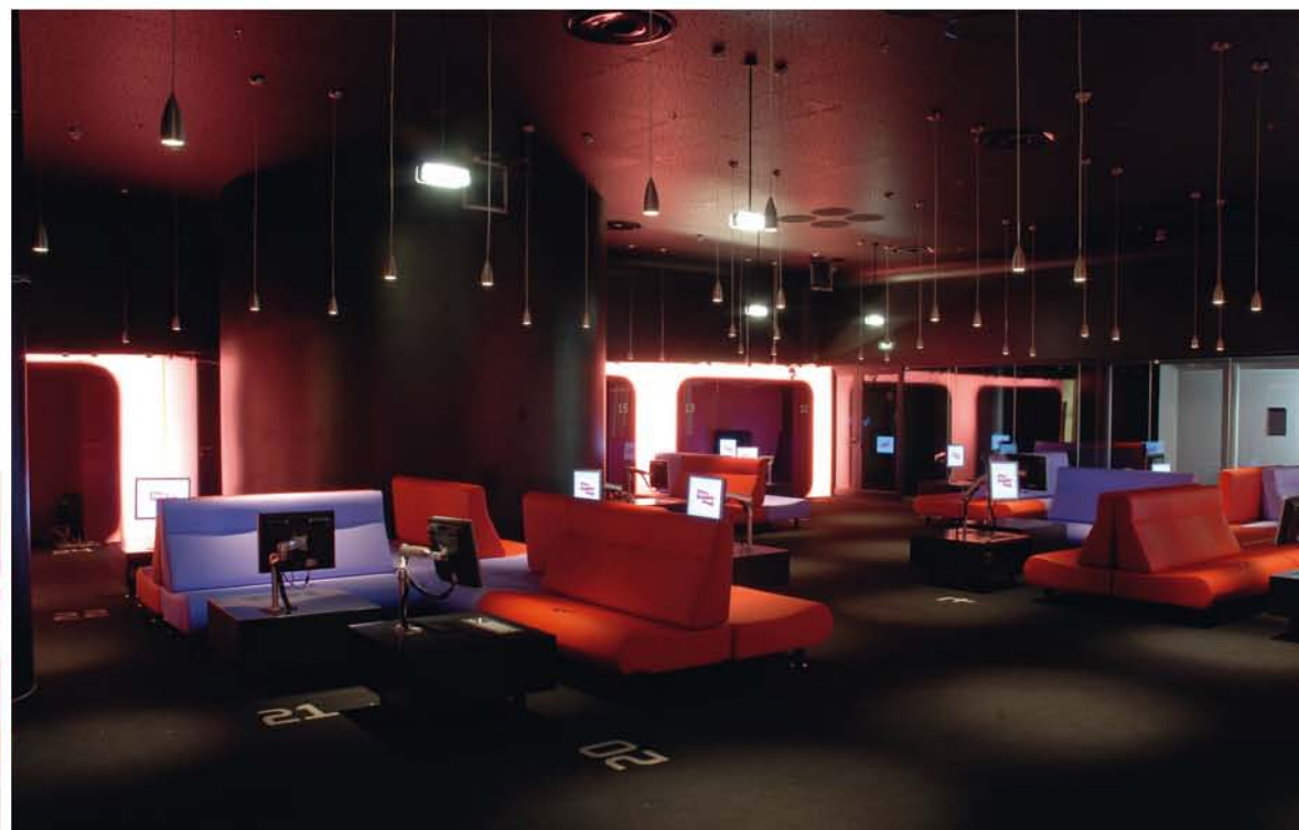
La Salle des collections