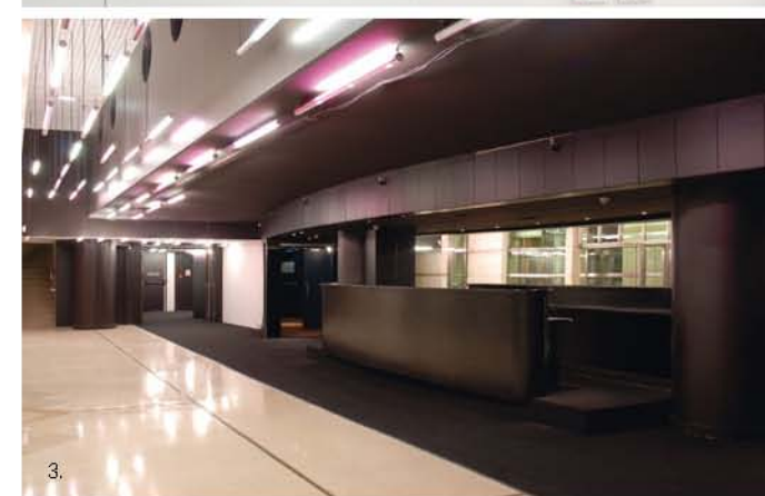
1. Espace de réception du Hall d'accueil 2. La signalétique signée Pierre Di Sciullo 3. Espace de réception du Foyer 500