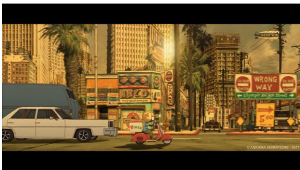
Mutafukaz de Shōjirō Nishimi et Guillaume « Run » Renard

Du 12 au 16 Décembre 2018 – 16 e édition