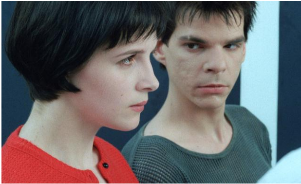
Mauvais sang de Leos Carax

Dans les années 1980, le cinéma français, avec des cinéastes comme Jean-Jacques Beineix, Leos Carax, Claude Miller ou Luc Besson connaît un sursaut formaliste qui se distingue du cinéma dominant. Cette rupture stylistique fut bien vite cataloguée comme une esthétique publicitaire. Or, ce tournant esthétique (et économique) demeure l'une des dernières tentatives de mue du modèle français (tentative restée tentation).