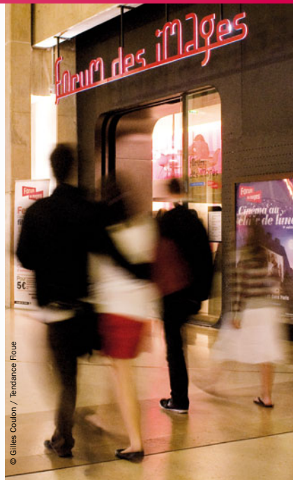
© Gilles Coulon / Tendances Floue

Forum des images | Forum des Halles | 2, rue du Cinéma | Paris 1 er M o Les Halles / RER : Châtelet-Les Halles