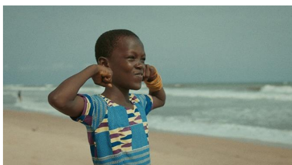
Da Yie

En partenariat avec le Festival du court métrage de Clermont-Ferrand