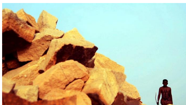
Faraw ka taama

En partenariat avec Le Fresnoy - Studio national des arts contemporains