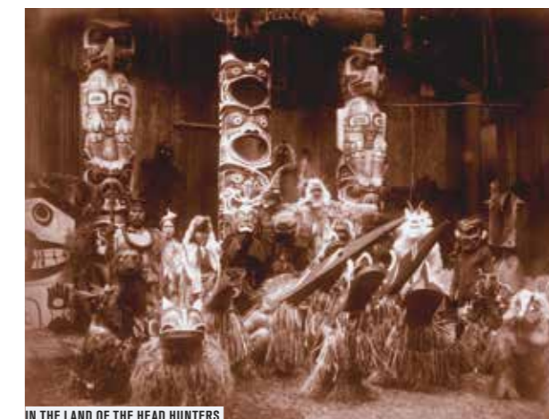
IN THE LAND OF THE HEAD HUNTERS

UN MARDI PAR MOIS À PARTIR DU 4 NOVEMBRE 2014