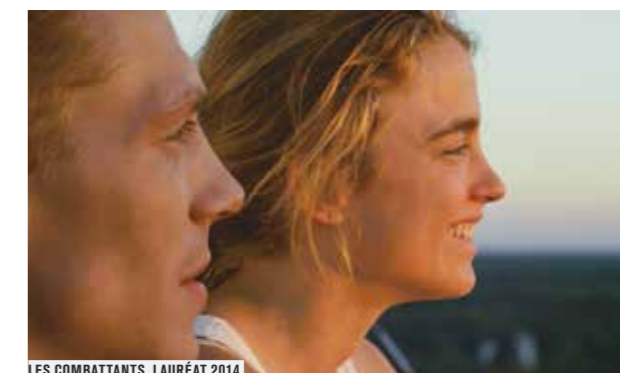
LES COMBATTANTS, LAURÉAT 2014

Quelques jours seulement après le clap de fin du Festival de Cannes, le Forum des images accueille la Quinzaine des Réalisateur s en reprenant l'intégralité de la sélection 2015, toujours très attendue.