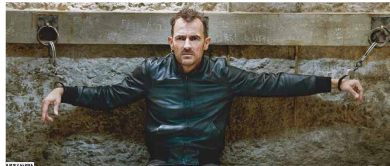
9 MOIS FERME

Des faits divers aux récits de procès, les films sur la justice dessinent une problématique commune, en dévoilant les aspects les plus complexes de la condition humaine. En plus de l'émotion et du plaisir qu'elles procurent, ces œuvres ouvrent aussi une possible réflexion sur la justice.