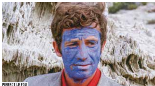
PIERROT LE FOU