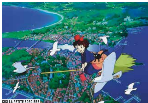
KIKI LA PETITE SORCIÈRE

CHAQUE MERCREDI ET SAMEDI À 15H DE SEPTEMBRE 2014 À JUIN 2015