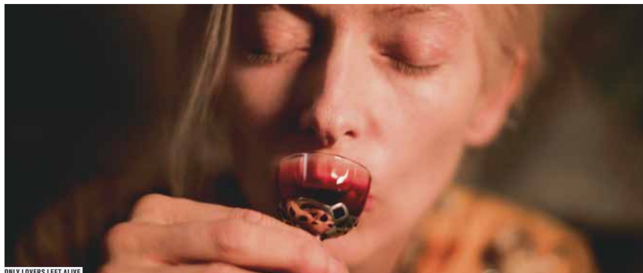
ONLY LOVERS LEFT ALIVE

La menace de la propagation du mal ne date pas d'hier, qu'elle ait le visage de la peste et du choléra comme autrefois, celui de l'étranger ou de l'envahisseur venu du ciel. Elle convoque un puissant imaginaire, où se mêlent fantasme et réalité, que ce programme offre l'occasion de parcourir au long d'un siècle de cinéma, miroir des peurs de son temps.