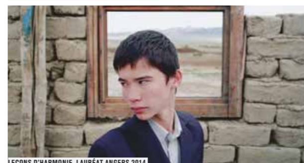
LEÇONS D'HARMONIE, LAURÉAT ANGERS 2014