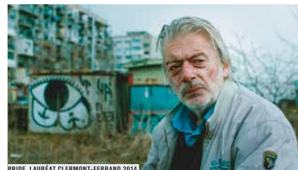
PRIDE, LAURÉAT CLERMONT-FERRAND 2014

Le festival est la manifestation de référence des formes audiovisuelles concises. Depuis sa création au Forum des images en 2000, il se développe considérablement et conquiert même les cinq continents. Avec des projections organisées simultanément à Paris et dans une centaine d'autres villes de trente pays, les Très Courts accompagnent l'apparition des nouveaux usages liés au développement des plateformes vidéos sur Internet et à l'arrivée des écrans nomades, smartphones et tablettes. C'est à Paris que se déroule chaque année la remise des prix de la très attendue compétition internationale , qui réussit la prouesse de réunir entre quarante et cinquante œuvres très courtes dans un programme d'environ deux heures. Aux côtés de cet événement phare, de nombreuses sélections thématiques sont proposées. Par exemple « Paroles de femmes », second programme en compétition, met en valeur un point de vue féminin ; « Music'n Dance » dresse un pont entre trois disciplines artistiques, la musique, la chorégraphie, la vidéo ; la sélection « Animation » présente un vaste éventail de techniques graphiques (2D, 3D, stop-motion...) ; la sélection « En famille » réunit le meilleur des Très Courts accessibles dès 7 ans ; « Travelling34 » aborde le thème du handicap sous toutes ses formes, très loin des lieux communs ; « Ils ont osé » est un mélange d'humour noir et de goût douteux, culte mais à déconseiller aux âmes sensibles. Au total, quelque 160 films à découvrir en un temps record.