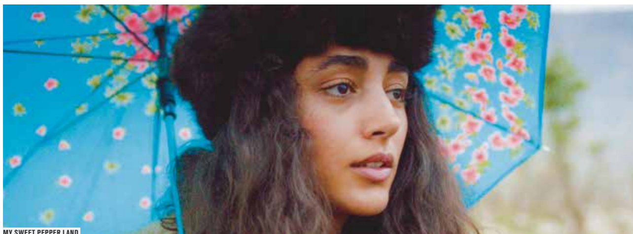
MY SWEET PEPPER LAND

Observer, analyser, questionner le monde par le prisme des films de fiction, tel est l'objet du festival Un état du monde... et du cinéma qui présente, sous le regard croisé de cinéastes et de personnalités de tous pays, des œuvres récentes sur des questions politiques, sociales, économiques, culturelles... Cette 6 e édition est placée sous le parrainage du journaliste et cofondateur du site Rue89 , Pierre Haski.