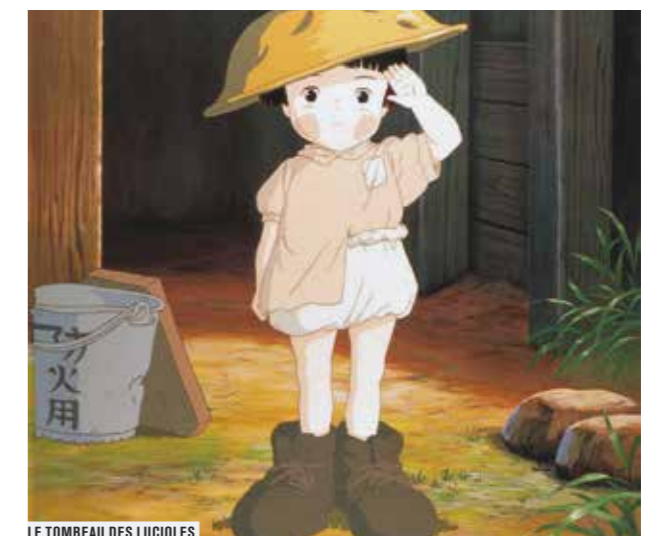
LE TOMBEAU DES LUCIOLES

Dans le cadre de la célébration des 25 ans de la Convention internationale des Droits de l'Enfant (CIDE) et en collaboration avec le Défenseur des droits, un week-end exceptionnel clôture ce programme, autour de films privilégiant la diversité des approches, des origines et des conflits : Bashu, le petit étranger de Bahram Beyzai (1985), Hope and Glory de John Boorman (1987), Promesses de Justine Shapiro, B. Z. Goldberg et Carlos Bolado (2002), Un héros de Zezé Gamboa (2004), Les Petites Voix de Jairo Carrillo et Oscar Andrade (2011) et Rebelle de Kim Nguyen (2012). Toutes ces projections sont accompagnées par des intervenants prestigieux.