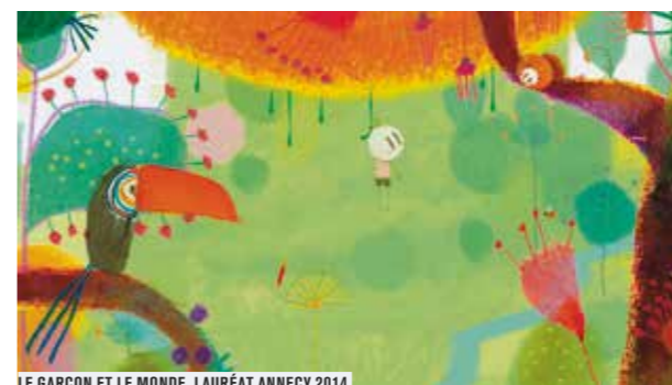
LE GARÇON ET LE MONDE, LAURÉAT ANNECY 2014