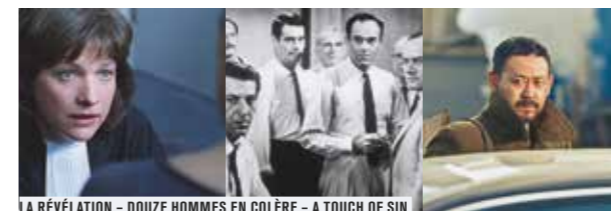
LA RÉVÉLATION - DOUZE HOMMES EN COLÈRE - A TOUCH OF SIN

Les philosophes ont pensé la notion de justice, cherchant ses finalités morales et politiques. Cet idéal est à confronter au jugement des hommes, forcément imparfait. Comment juger et punir ? L'acte de juger et l'application de la loi diffèrent selon les cultures et les époques. La récente réforme de la justice remet au centre des débats la scène judiciaire et ses acteurs, mais aussi les interrogations d'une opinion publique qui réclame plus de justice, à travers une exigence à la fois de distance et de proximité, de rigueur et d'humanité. Dans le même temps, la figure de la victime et sa souffrance tendent à réorienter le sens de la peine.