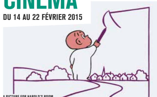
A PICTURE FOR HAROLD'S ROOM

Le premier festival du genre en France initie les plus jeunes, de 18 mois à 4 ans, aux merveilles du 7 e art. Tout en douceur, ils expérimentent le plaisir de la projection sur grand écran et la joie d'être ensemble pour découvrir les chefs-d'œuvre du patrimoine et de la création contemporaine.