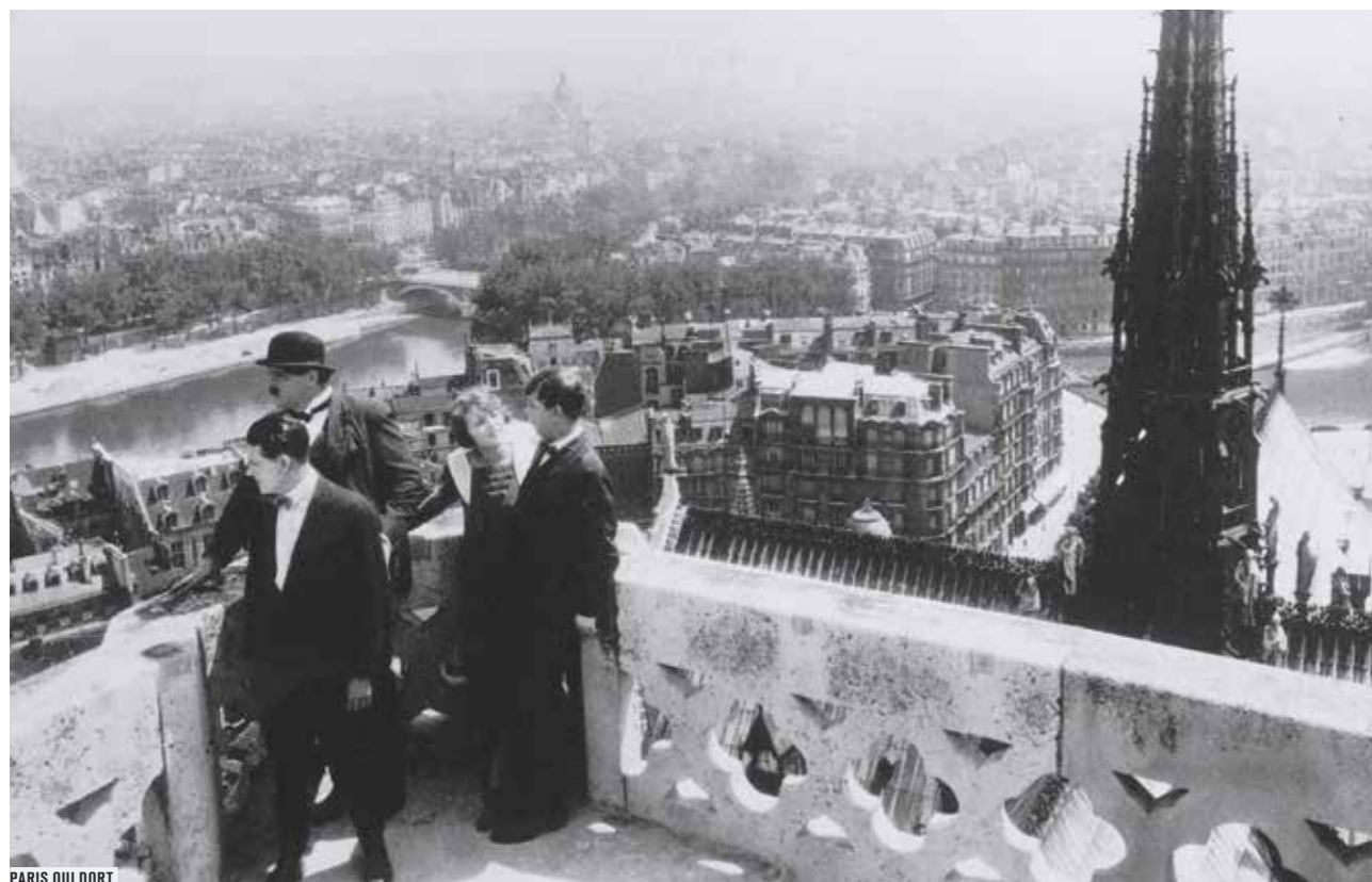
PARIS QUI DORT

CHAQUE MOIS DE SEPTEMBRE 2014 À JUILLET 2015