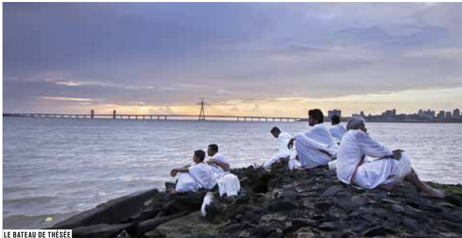
LE BATEAU DE THÉSÉE

Le cinéma indien existe en dehors de Bollywood. Un grand nombre de réalisateurs perpétuent ainsi la tradition du film d'auteur et apportent une vision sociale et politique inédite de leur pays.