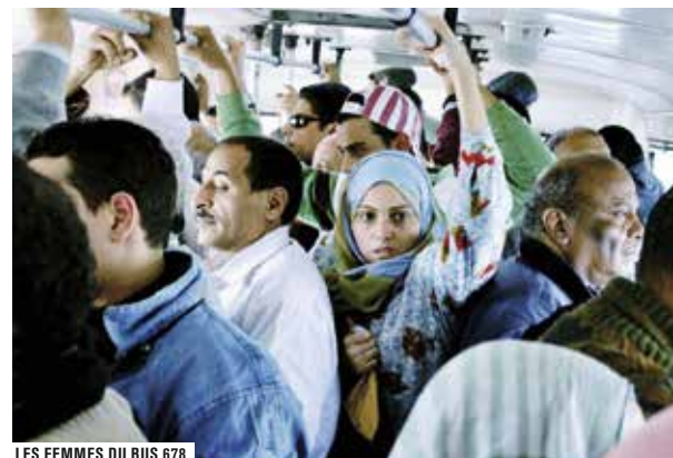
LES FEMMES DU BUS 678

EN PRÉSENCE DE LA RÉALISATRICE MARDI 12 NOV. À 19H30