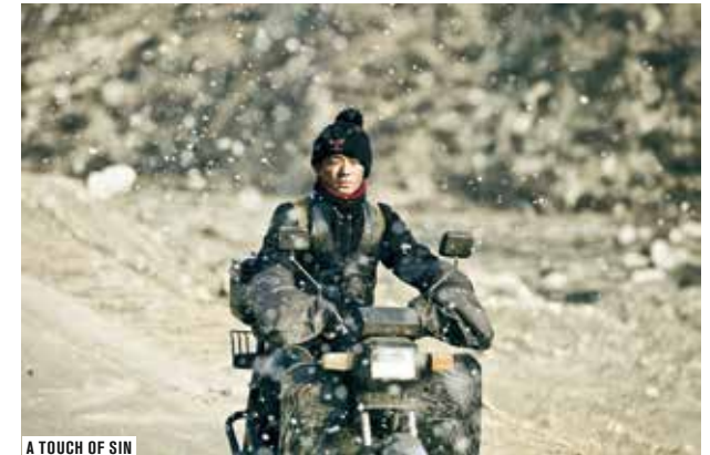
A TOUCH OF SIN