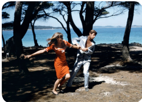
Pierrot le fou

Jardins du Trocadéro (face aux fontaines) / M° Trocadéro