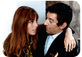
Slogan / Collection Christophel

Pelouse de Reuilly / M° Porte de Charenton