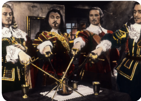
Les Trois Mousquetaires

Place des Vosges, square Louis XIII / M° Chemin-Vert ou Saint-Paul