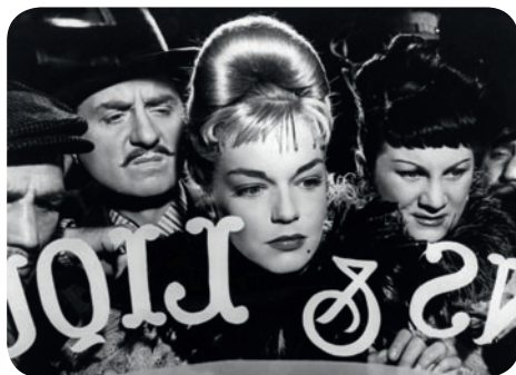
Casque d'or

Butte Montmartre, square Louise Michel (entrée place Saint-Pierre) / M° Anvers