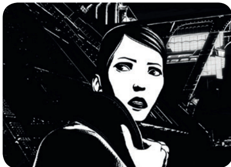
Renaissance / DR

Parc Montsouris (entrée à l'angle de la rue Nansouty et de l'avenue Reille) / RER Cité-Universitaire