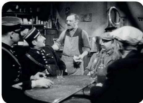
Goupi mains rouges

Terrain de Sport Ménilmontant (49, bd de Ménilmontant) / M° Père Lachaise