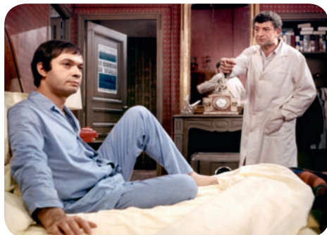
Le Cinéma de papa

Jardin des Champs-Élysées (derrière le théâtre Marigny) / M° Champs-Élysées Clemenceau