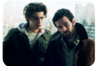
Dans Paris

Place René Cassin (jardins en face de l'église Saint-Eustache) / M° RER Châtelet-Les-Halles