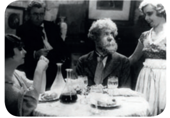
Boudu sauvé des eaux

Avenue de Breteuil, Place Henri-Queuille / M° Sèvres-Lecourbe