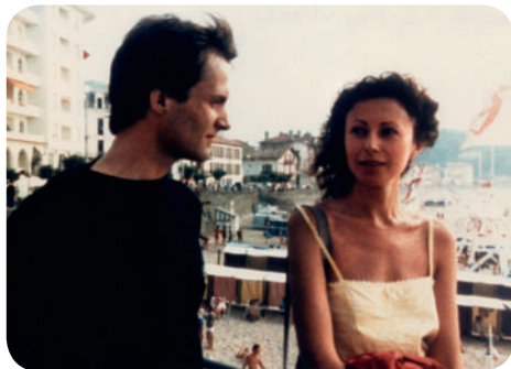
Le Rayon vert

Parc André Citroën (sur le parvis entre les deux grandes serres) / M° Balard