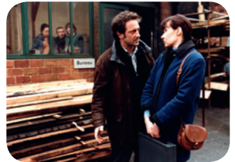
Ma petite entreprise