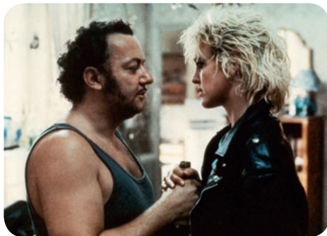
Tchao Pantin

Parc de Choisy (entrée principale avenue de Choisy) / M° Tolbiac ou Place d'Italie