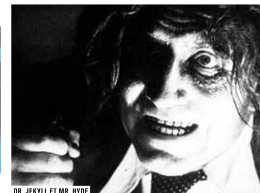
DR. JEKYLL ET MR. HYDE