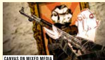
CANVAS ON MIXED MEDIA

AU PROGRAMME : BULLET / ABC DOUBLESPEAK / CANVAS ON MIXED MEDIA / DEMAIN L'ADIEU / STOP KILLING SYRIAN CHILDREN / ELECTROSTATIC / SANS FOI NI LOI / SHORT DREAM / FOUAD / 30% WOMEN & POLITICS IN SIERRA LEONE / MEMENTO-MORI / JODA / BECAUSE I'M A GIRL / COGITATIONS / WARDA / ESTELLE'S STORY / ABO HABASH (SYR. LIB. CAN. BELG. G.-B. BOL. ANIM. 2008-2013 N&B ET COUL. 1H30 VIDÉO).