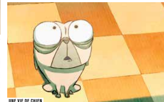
UNE VIE DE CHIEN