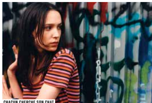
CHACUN CHERCHE SON CHAT

Pour les plus grands, 150 films sont également à découvrir en Salle des collections !