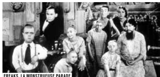
FREAKS, LA MONSTRUEUSE PARADE

Au long de sa carrière, Alejandro Jodorowsky a montré un attrait certain pour les particularités physiques et le monde du cirque. Il a d'ailleurs été inspiré par Tod Browning, comme il le dit dans le livre d'entretiens « De la cage au grand écran » (Éd. K-Inite, 2009) : « À mes yeux, les monstres sont déguisés, et c'est pour cela qu'ils m'ont toujours plu. Freaks de Tod Browning m'a énormément marqué. Je l'ai vu étant enfant. Lorsque j'ai fait Santa Sangre , j'ai eu la surprise d'y retrouver une ressemblance totalement frappante avec L'Inconnu , que je n'avais jamais vu, tandis que Freaks était la seule influence d' El Topo venant de Browning. Après j'ai vu les autres Browning, et Lon Chaney et lui devinrent mes préférés. » Il a choisi de présenter L'Inconnu (1927) avec un Lon Chaney inoubliable en manchot, avant de revenir sur la thématique de la monstruosité dans Santa Sangre .