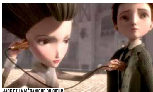
JACK ET LA MÉCANIQUE DU CŒUR