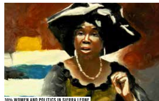
30% WOMEN AND POLITICS IN SIERRA LEONE