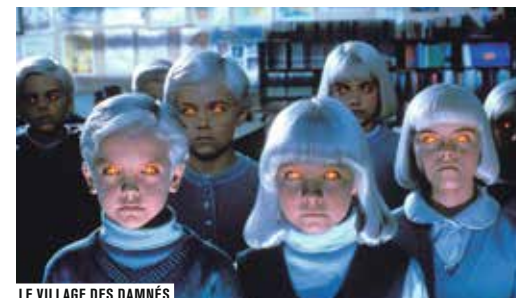
LE VILLAGE DES DAMNÉS

Les années 60 avaient ouvert le bal avec Le Village des damnés de Wolf Rilla, dont John Carpenter livrera un remake. Au début des années 70, aux États-Unis, la fracture entre la jeunesse et les adultes est de plus en plus importante. Certains parents ont même l'impression d'avoir enfanté des monstres en raison de comportements qu'ils ne comprennent pas. De ce constat, Larry Cohen tire le scénario d'une véritable étude sociale, Le monstre est vivant (1974). En 1976, Narciso Ibanez Serrador signe ce que l'on peut considérer comme le chef-d'œuvre du genre, Les Révoltés de l'an 2000 . Sur le thème de l'enfance maléfique, De si gentils petits monstres de Max Kalmanowicz est l'un des titres de gloire des années 80, tout comme Les Tueurs de l'éclipse d'Ed Hunt, tourné en pleine période faste du « Slasher ». Un week-end entier pour rencontrer ses enfants monstres aux visages angéliques, capables de détruire l'humanité, êtres surhumains ( Carrie ), enfants mutants ou contre-nature ( Eraserhead ), etc.