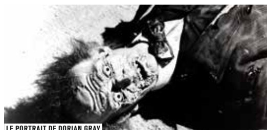
LE PORTRAIT DE DORIAN GRAY

OFFREZ UN AN DE CINÉMA AVEC LA CARTE FORUM ILLIMITÉ