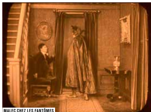
MALEC CHEZ LES FANTÔMES

Avec 150 films pour les petits curieux et des ciné-jeux multimédias, la Salle des collections est une véritable caverne d'Ali Baba pour les enfants ! Des moments de cinéma à partager en famille chaque après-midi.