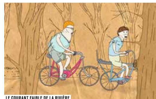
LE COURANT FAIBLE DE LA RIVIÈRE

Le format du court métrage est sans doute le plus adapté pour exprimer la diversité des techniques, des sensibilités et l'innovation constante du laboratoire permanent qu'est le cinéma d'animation. Six programmes éclectiques en font de nouveau la preuve cette année : tout nouveaux courts métrages français d'auteurs, sélection thématique de films politiques, cartes blanches au festival Siggraph et à l'Abbaye de Fontevraud, sélection internationale spéciale Musique et Son... Un sacré festin!