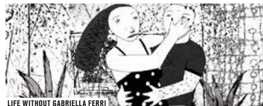
LIFE WITHOUT GABRIELLA FERRI