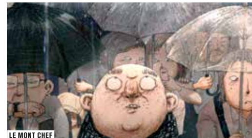
LE MONT CHEF

En 1999, dans le cadre du festival Nouvelles images du Japon , le Forum des images mettait en avant l'œuvre de Kôji Yamamura à travers un programme de ses films destinés au jeune public. Nommé aux Oscars, Grand Prix à Annecy puis à Zagreb et Hiroshima, son court métrage Le Mont Chef (2002) a depuis révélé un réalisateur indépendant d'importance sur la scène animée internationale, et marque un net basculement vers une exploration à la fois plus mature et plus focalisée du champ de la création animée. Invité en 2003 à la 3 e édition de Nouvelles images du Japon dont il signa l'affiche, Yamamura revient cette année au Forum des images en tant qu'invité du Carrefour du cinéma d'animation , et parrain du « Cadavre exquis animé ». Deux séances (une projection et une conférence) sont l'occasion de découvrir l'envergure et la cohérence du parcours de cet auteur au cours de la décennie écoulée, la réflexion et les références formelles qui sous-tendent son travail, ainsi que ses travaux les plus récents.