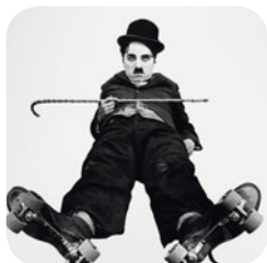
Charlot patine