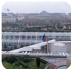
Le forum des Halles